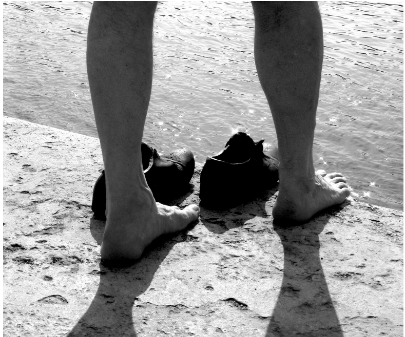
Ketten a folyóban (Fotó: Falcsik Mari, 2011)

A vízben nem olyan könnyű az élet, mint a levegőben. Ha ember vagy, még bele is fulladhatsz. És ne is ábrándozz arról, hogy a felszínén fogsz lépegetni, mint a világisten fia. Meg kell tanulnod a vízben állást . Beúszol a folyó közepére, és elfelejted, hogy tüdővel lélegzel. Összezáród a lábad, a derekad mellé szorítod mindkét karodat, és csöndesen figyeled a szíved dobolását. Lesüllyedsz, mint a kavicsok, amiket a kölykök dobnak kacsázni, aztán csak a halk merülés következik. Szeretsz lefelé, bátran és szívtelenül, de ki emlékszik akkor már rád. Lebegsz lefelé, sápadt bőrödöt karcolja az elszökő elmúlás, és végül egy hangtalan kőszirt áll a talpad alá. Nem gondolsz semmire, nem vágysz létezhetetlen létezések után. Akkor fölvet magából a Duna, öntudatlanul fogadod el nemtelen kedvességét, ez az utolsó simogatás. Állsz a vízben, mellig kiemelkedve, megrendülten, rád az érthetetlen jövő sebes féreglyuka vár.