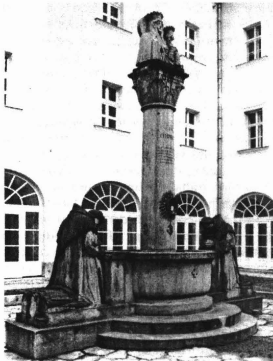
Ligeti Miklós: Béke kút, 1916

A firenzei Platóni Akadémia jeles tagja mesteréhez hasonlóan vallotta, hogy a „természet könyvét” és a „kinyilatkoztatás könyvét” együtt kell olvasni, illetve mások olvasataitól sem szabad elzárkózni, hiszen a felismert lényeg rögzítésének nagyon különböző formái lehetnek, a legrejtélyesebb nyelvi képződmények is „Isten ábécéi”, és érdemes kibetűzni az általuk leírtakat. Nem a reneszánsz kori humanisták Flacius-féle hermeneutikája ez, és távolról sem az a fajta tudományosság ez még, ami majd a felvilágosodás hagyománykezelő szemléletét jellemzi, de olyan általános vonatkozásban mégis anticipálja Vico felfogását, hogy a legrégebbi szövegekből indul ki, nagyra becsüli forrásértéküket , és azok folytatójaként és kiteljesítőjeként jut el saját helytállóbb elméletéhez. Pico még nem tudhat arról — Galilei előtt —, hogy a természet könyvét a „matematika nyelvén írták”, sem arról — Vico előtt —, hogy az ember legalábbis társszerzője a Gondviselésnek az emberi történelem megírásakor. Arra viszont nagyon büszke — akárcsak a platonizmus szelleme által szintén megérintett Nicolaus Cusanus és Carolus Bovillus —, hogy Isten ezt az egész világot az ember számára teremtette, és az ember a maga módján nagyon hasonlít mind a kettőhöz.