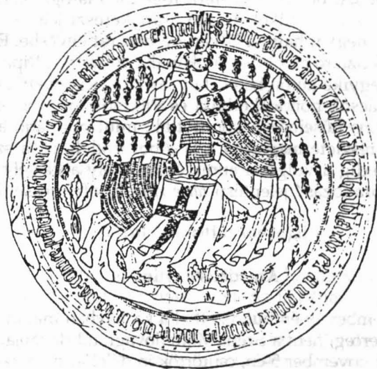
VIII. Amadé szavojai herceg nagypécsettje

Különös egyénisége és sorsa Voltaire-t is megragadta, verset írt róla. Néhány szava akár epitáfium is lehetne: O bizarre Amédée!