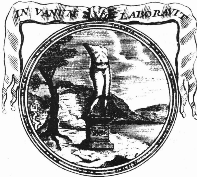
A múltékonyságnak ( Emblemes ou devises chretiennes, Lyon 1701 )

Ilyen szavakkal élünk: magunkévá hasonítjuk, rajtakapjuk, fölnezzünk reá, elfordítjuk a fejünket, megvilágításba helyezzük. Vélhetően ezeknek a gesztusoknak a mentén húzódik a határvonal, melyen túl már a szeretet kezdődik. Megszámlálhatatlanul sokféle ez is. Az bizonyos, hogy nem birtokol, nem vár el, illetőleg nem esik kétségbe, ha elvárása nem teljesül. Nem követni akar, hanem kísérni, ugyanott lenni, ahol a másik, még hozzá meghatározatlan időre. Bármilyen furcsa, ez a gyengéd érzelem kevésbé sérthető és sebezhető, mint a tisztelet, mert a hibákkal, vétkekkel, tökéletlenséggel eleve és létszerűen számol — persze mintegy ösztönösen, öntudatlanul. A szeretetnek annyira kell a másik, hogy az a másik nem hozhatja zavarba egykönnyen. Nincs időbeosztása sem: mindig készen, sőt résen áll, lényege épp az elidőzés, a vele töltött idő végtelen meghosszabbítása. Ha a tisztelet szabályosan és igényesen választja le tárgyaról az esetlegesnek látszó fogvatékosságokat, a szeretet mintha gátlástalanul és nem-törődöm módra vetné oda újra meg újra a másiknak: tudom, hogy több vagy. Szemében a személyiség ideálja nem az arc, a magatartás fölött lebeg, hanem annak suta ráncain, együgyű fintorain, emennek kínos botladozásán, ügyefogyott vétkein is átdereng.