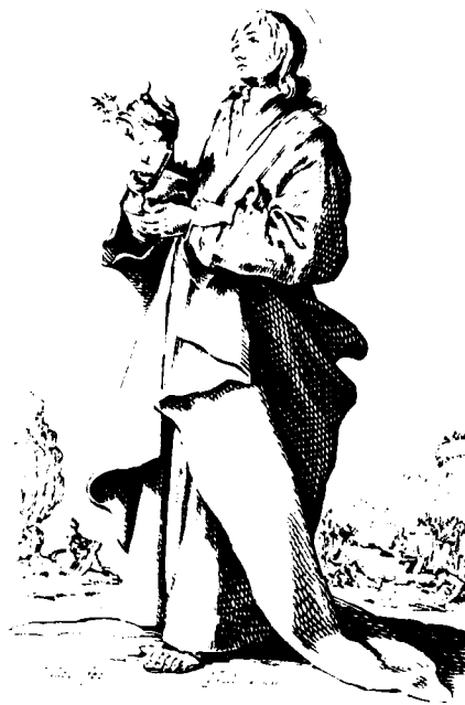
Szent János evangélista (Jacques Callot metszete, 17. sz.)

E szavakat elhangzásuk idején még sokan csalódottan hallgatták, mert határukra elsősorban az „egyházi rendszerváltás” késleltetésétől tartottak. Mára ennek az üzenetnek a mélyebb mondanivalója sokkal világosabb, mint annakidején. De vannak-e még fülek, melyek képesek ezt meghallani?