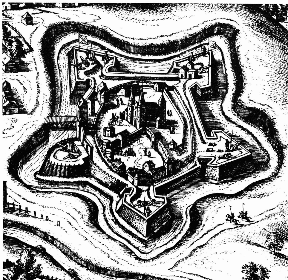
Nagyvárad látképe 1598 körül Georg Houfnagel rézkarca

A Szent László-himnuszt sorának „visszazengése” így szó szerint is, jelképeesen is igaz; mintha figyelmeztetne bennünket az 1092-es alapítás, az 1192-es kanonizálás és az 1692-es török alóli felszabadulás ünnepi akkordjaira.