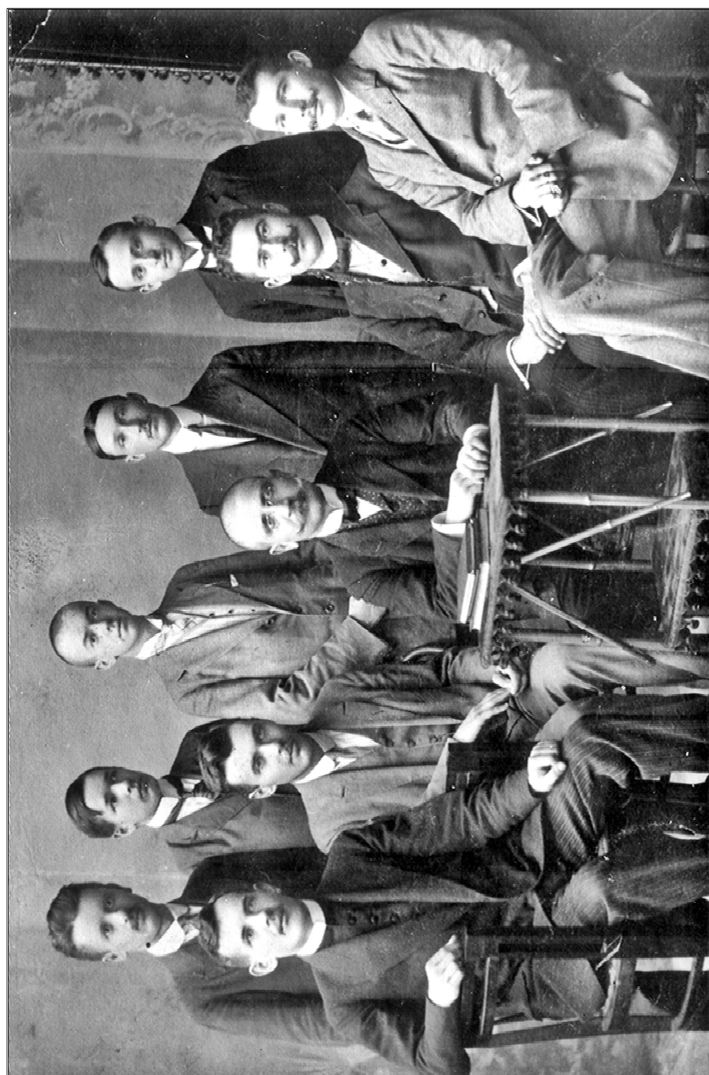
Pongrácz József tanítványai körében (1910-es évek)