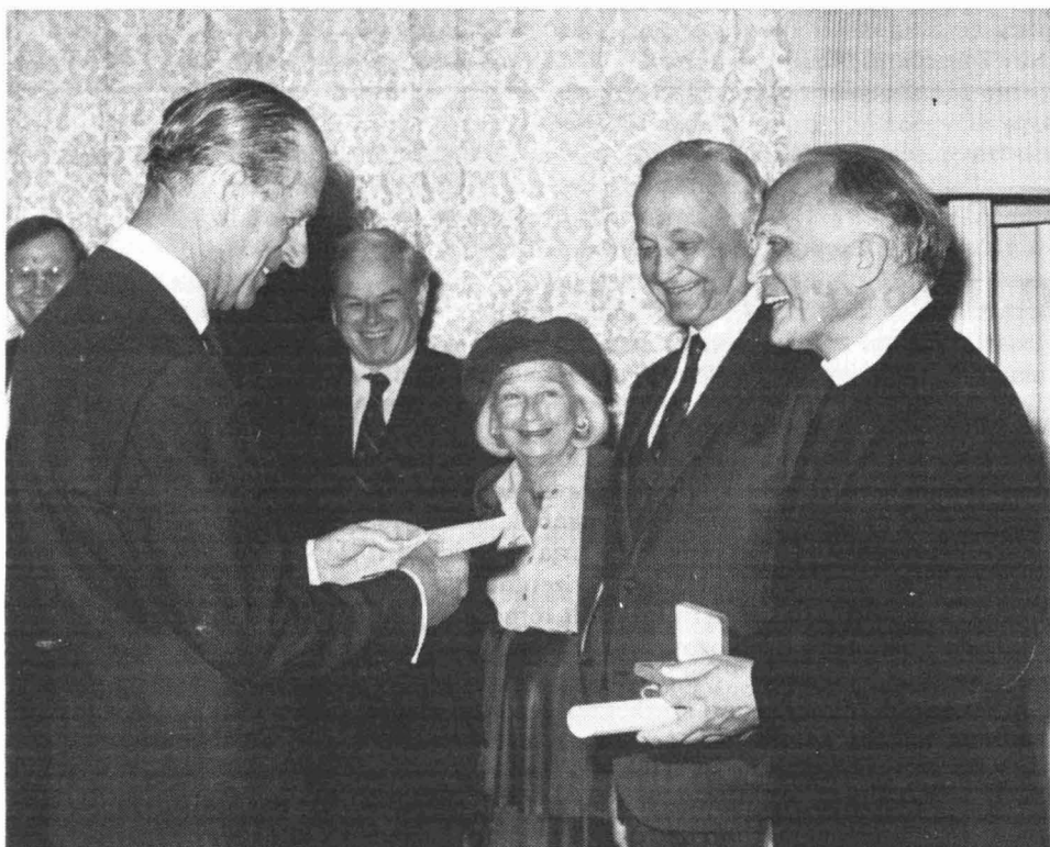
FÜLÖP HERCEG ÁTADJA A DÍJAT JÁKI SZANISZLÓNAK A TEMPLETON HÁZASPÁR JELENLÉTÉBEN

tei) elegendő bizalmat adhatnak ahhoz, hogy lehetőnek tartsuk az előrehaladást a kölcsönös megértésben. De ez a haladás csak akkor jöhet létre, ha az emberiség, amelyik egyre inkább hozzákötődik a tudományhoz, kész meghajolni Isten előtt.