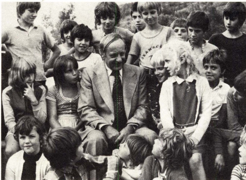
GMEINER PROFESSZOR NEVELTJEI KÖZÖTT

AZ SOS GYERMEKFALU MAGYARORSZÁGI EGYESÜLET VEZETŐSÉGE SZERETETTEL VÁR MINDENKIT, AKI AZ ITTHONI MUNKÁBAN ERKÖLCSILEG VAGY ANYAGILAG SEGÍTENI TUD! CÍM: 1054 BUDAPEST, ARANY JÁNOS U. 31.