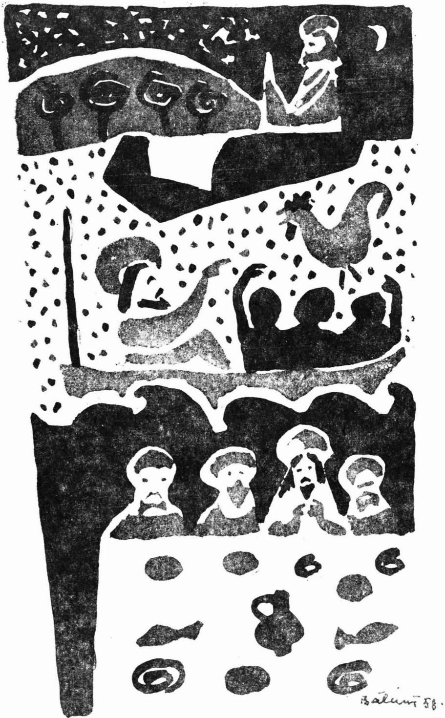
Bálint Endre munkája