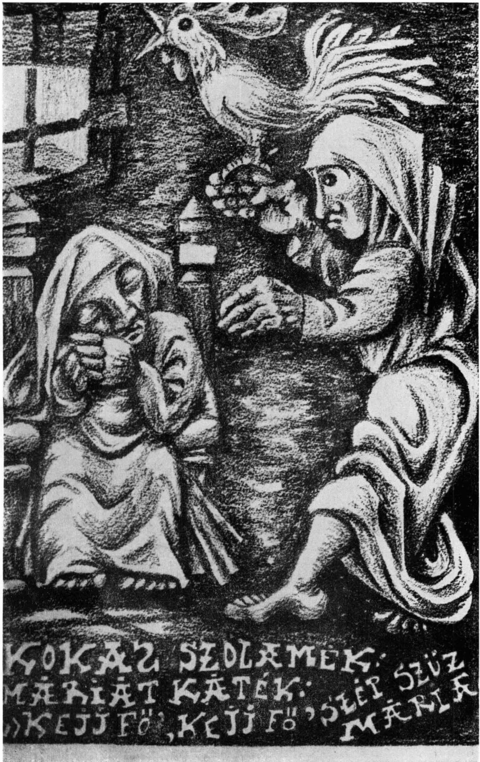
Gyovai Eszter munkája