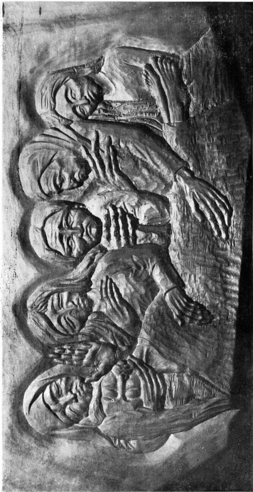
György Eszter munkája