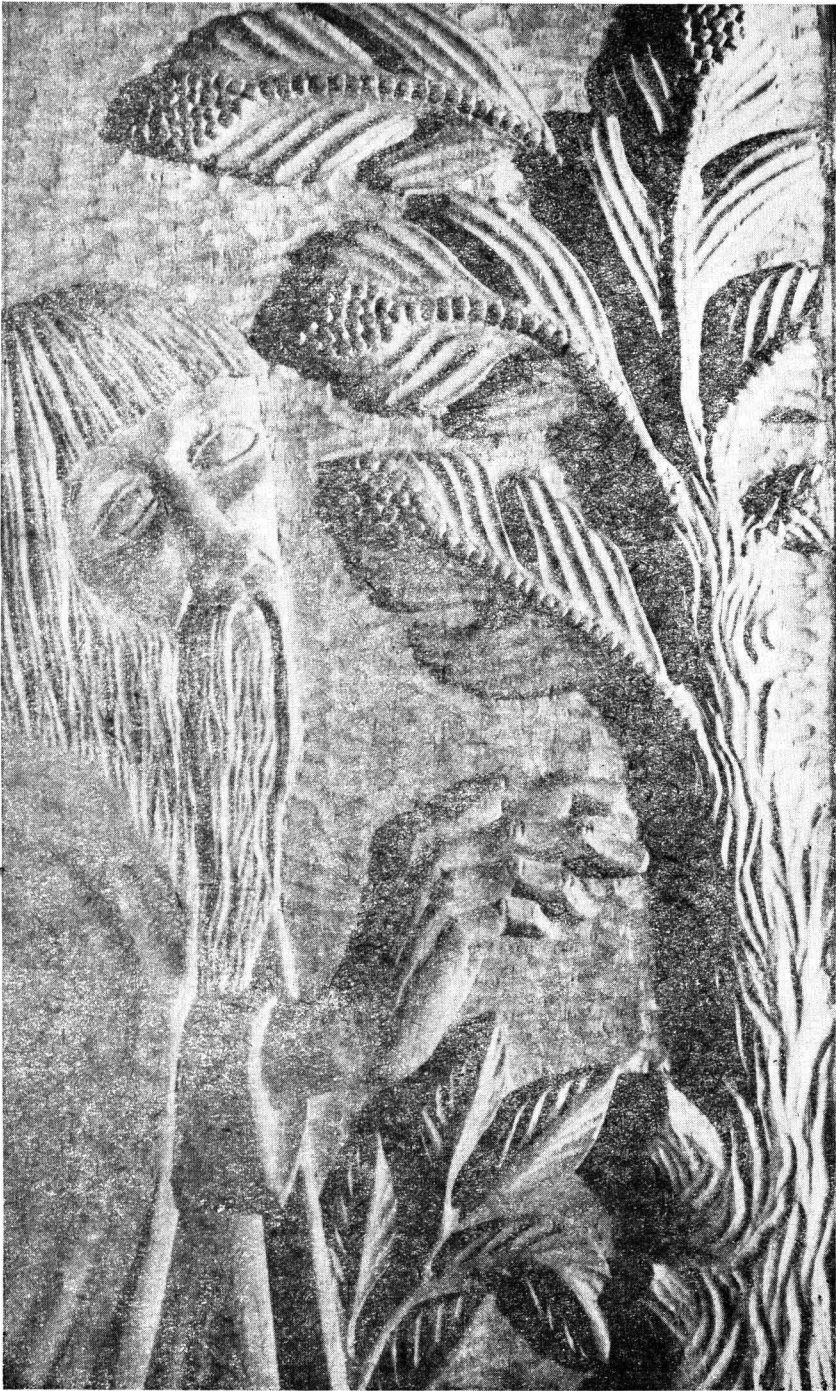
Gyovai Eszter munkája