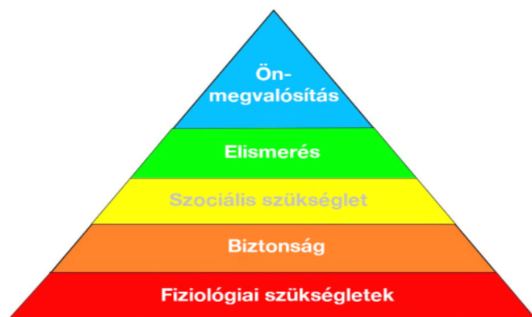
1. ábra. Maslow (1943) szükséglet piramis

A munkavállalói motiváció a szervezeti működés egyik alapvető tényezője, amely közvetlen hatással van a teljesítményre, az elégedettségre és a szervezethez való kötődésre. A motiváció meghatározza, hogy a munkavállalók milyen mértékben hajlandók erőfeszítést tenni feladataik ellátása során [1][11]. A motiváció elméleti megközelítései közül az egyik legismertebb Maslow szükséglet-hierarchia-elmélete, amely szerint az emberek különböző szükségletek kielégítésére törekednek, hierarchikus sorrendben [5][12]. A munkahelyi környezetben ez azt jelenti, hogy az alapvető szükségletek kielégítése után jelennek meg a magasabb szintű igények, mint az elismerés vagy az önmegvalósítás.