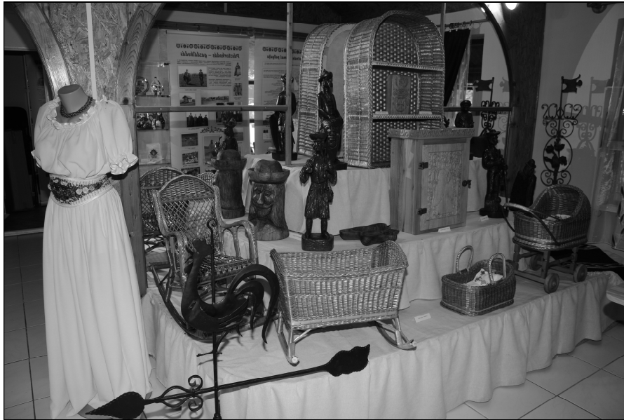
Nagykun értékek a kiállításban

Röviden bemutatom az új kezdeményezést. Először is mit jelent, honnan származik a név, KUNIKUM? A szó kitalálója Gyárfás István, aki a jászkunok történetének elhivatott kutatója, mindezidáig a Jászkunság legrészletesebb bemutatásának írója. A négykötetes munka 1883–85-ben jelent meg. Egyik írásában javasolta, hogy legyünk büszkéek a „ kunikum ”-okra, azaz mindarra, amit a kunok évszázadokon át alkottak, ami jellemző a kultúrájukra, amit őseik keletről hoztak, ami a letelepedésük utáni életüket, tárgyi és szellemi kultúrájukat jellemzi.