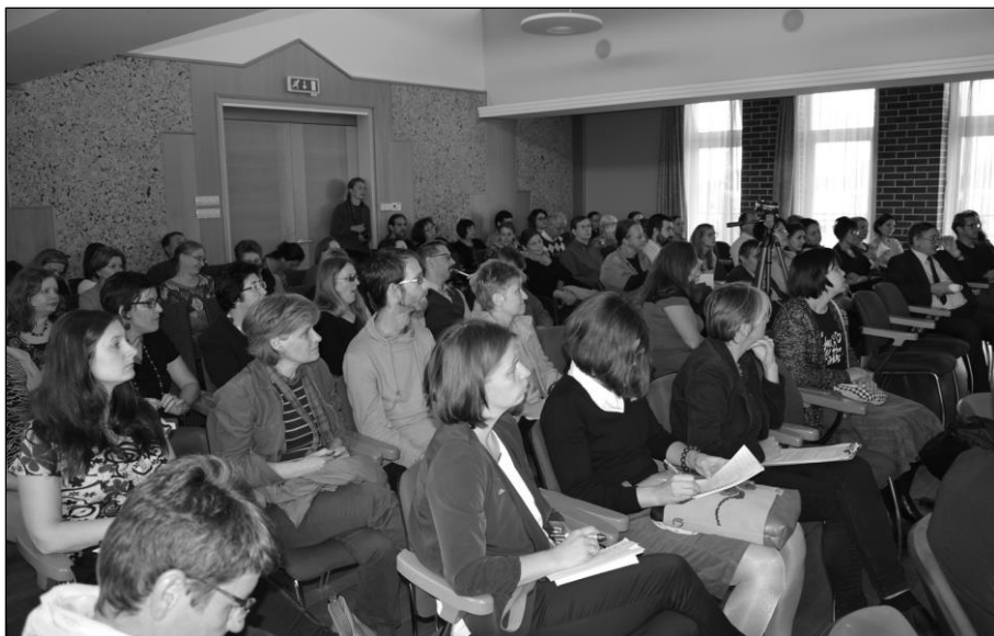
A konferencia résztvevői