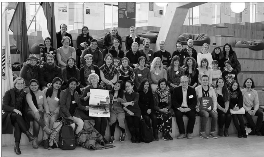
A konferencia résztvevői

viszonyok, az egyének és csoportok közötti összefüggések a mai, összetett kapcsolatokon keresztül működő világban. Mint ilyen, a kötődés tematikája szorosan kapcsolódik a különböző társadalmi egyenlőtlenségekhez, a többszörös identitásokhoz és más interdiszciplináris kérdésekhez. A 2017-es konferencia témája tehát a mindennapokban tapasztalt és megélt bármilyen jellegű kötődés, valamint annak a hagyományos gyakorlatokra és tudásformákra való hatása, illetve kreatív felhasználása köré szerveződött. Mindemellett pedig a Tartui Egyetem legújabb angol nyelvű, Folklorisztikai és alkalmazott örökség tanulmányok (Folkloristics and Applied Heritage Studies) MA-programja is külön figyelmet kapott.