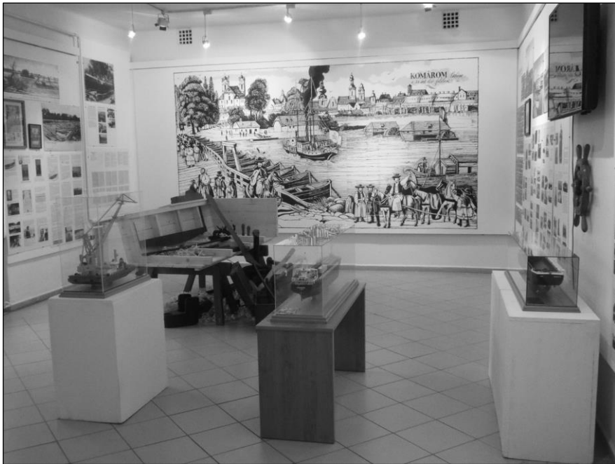
Részlet a kiállításból

Komárom mindig fontos szerepet töltött be a magyar hajózásban. Kikötőjét már a 11. században említik, IV. Béla idejében pedig már biztosan jelentős forgalma volt a kereskedelemnek köszönhetően. A későbbi korokban a hadászat is fontos tényező lett, hiszen a török háborúk idején (16. század) kezdtek tömeges hajóépítésbe. Az ezt követő századokban is, egészen a gőzhajók megjelenéséig jelentős történelmük van a hajóácsoknak, hajóépítőknek, akik közül az utolsók egészen 1944-ig tevékenykedtek.