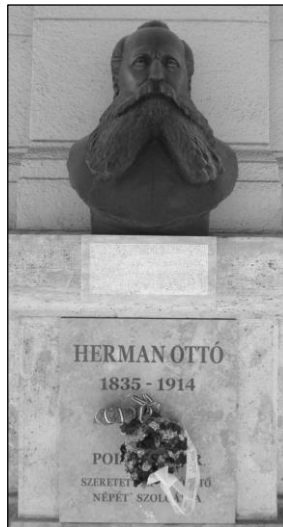
Herman Ottó 2014-ben felavatott mellszobra a Földművelésügyi Minisztérium árkádjai alatt