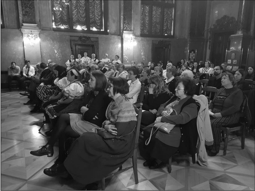
A rendezvény résztvevői