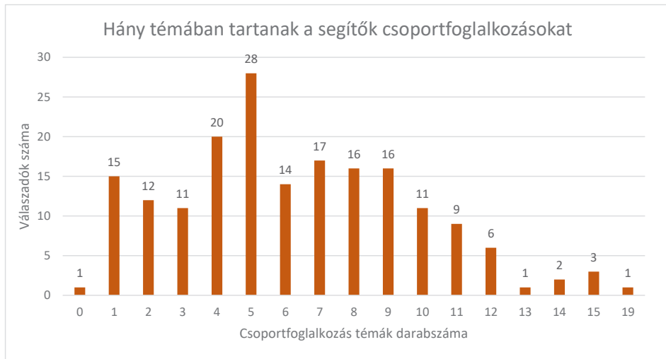
1. ábra Óvodai és iskolai szociális segítők által tartott csoportfoglalkozás témák számának alakulása (n = 183)

A csoportfoglalkozások tekintetében, a csoporttémák esetében 6-7 különböző témában tartanak foglalkozásokat a segítők. 100 fölötti értéket kapott a témák közül (123 db) konfliktuskezelés, (115 db) az önismeret, (107 db) osztálykohézió és (103 db) a bullying. Továbbá 12 fő egyáltalán nem szokott csoportfoglalkozást tartani. (1. ábra).