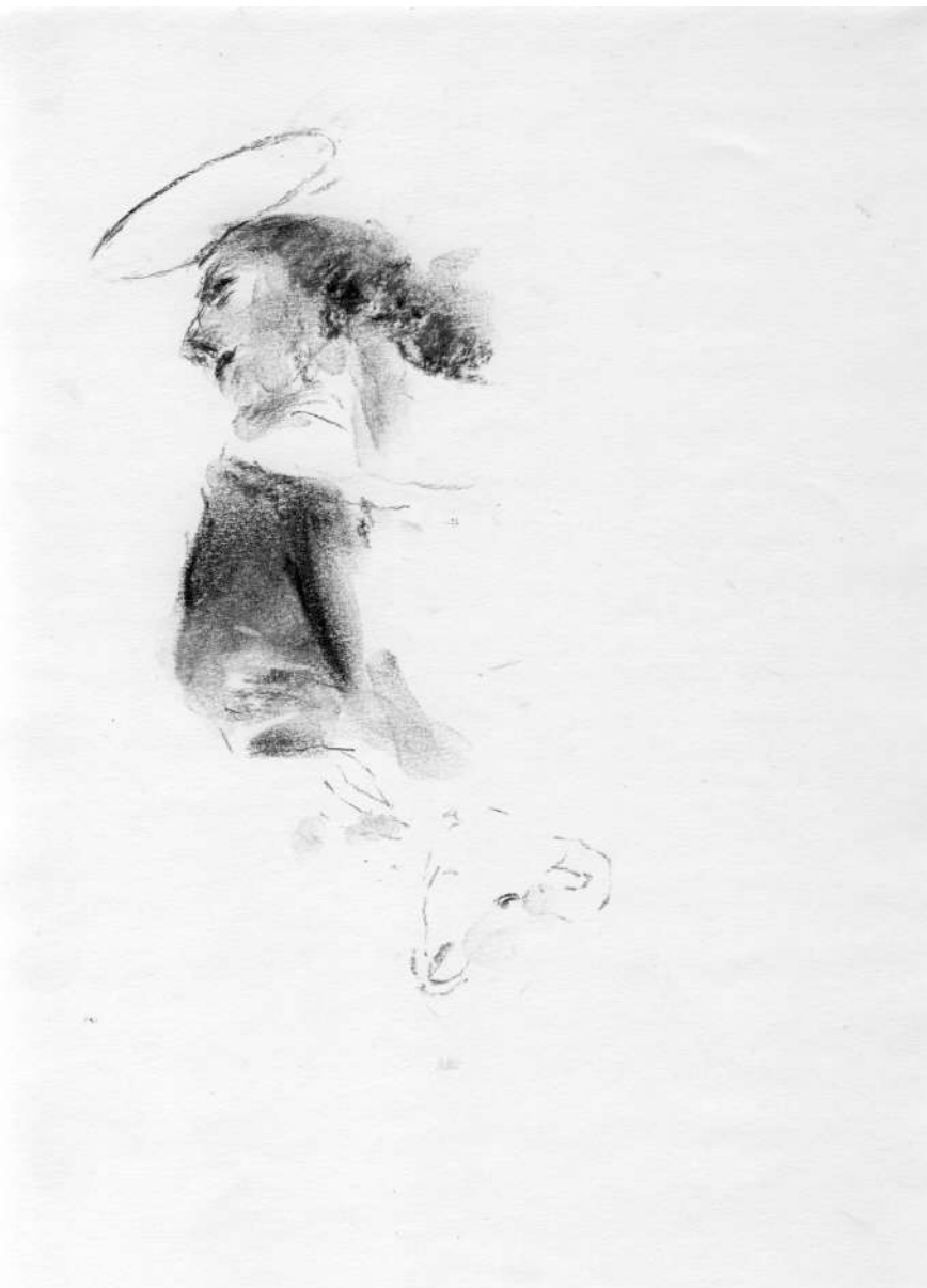
Új Forrás 2023/10 – Jaroslav Hašek: A lassú utazás Tátrai képek

Eredeti cím: Pomalá jízda. Podtatranská črta. Eredeti közlés: Národní listy odpoledný 1904. 08. 20.