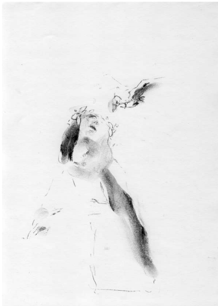
Új Forrás 2023/10 – Wehner Tibor: A testek és a dolgok testet öltése és szertefoszlása – Kárpáti Tamás festőművész kiállítása