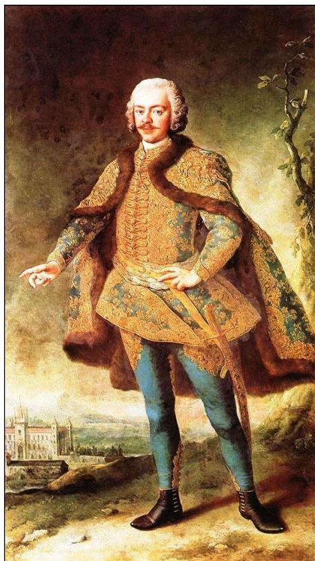
2. kép. Bányfy Dénes (Martin van Meytens festménye).

bíztatta Csáky grófnőt is. Ugyanakkor szívesen meghallgatta a házaspár kisebbik lányának, Rozáliának kiházásítására vonatkozó elképzeléseket, tanácsokat adott a férjnek, Bethlen Miklósnak is, felvetve, hogy neki is van egy fia, Dénes, aki éppen most tér vissza Szebenbe, még az is lehet, hogy a fiatalok megtetszenek egymásnak. (Az utóbbi tervet azonban a fiatalember 1773-ban bekövetkezett halála végleg megghiúsította.)