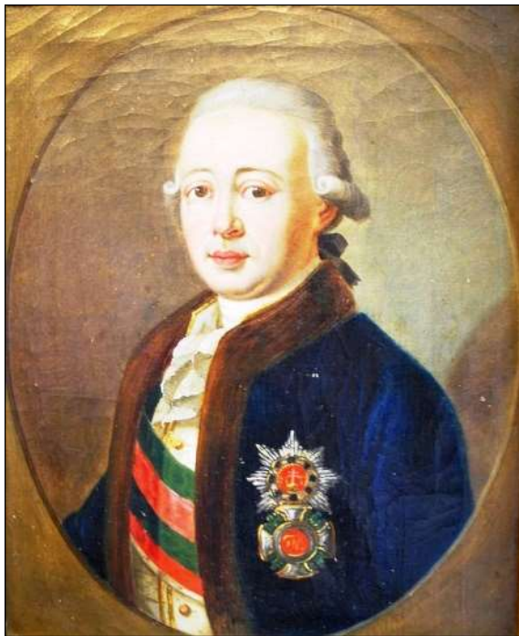
4. kép. Bánffy György gubernátor.

Csáky Kata leveleinek második csoportja egyértelműen Bánffy György gubernátorhoz (1787–1822), Bánffy Dénes idősebb fiához szolt.