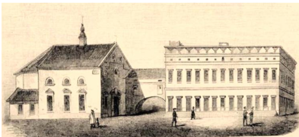
Az Eperjesi Kollégium 2

Nyíregyháza 18–19. századi szellemi életére talán a legnagyobb hatást az Eperjesi Kollégium gyakorolta. Erre predesztináltatott is a közösség, hiszen egyik birtokosa, gróf Károlyi Ferenc 1753-ban felvidéki gyökerekkel rendelkező, békési evangélikus „ tót szababad menetelű jobbágyokat ” telepített ide, a 18. század második felében pedig a Felvidékről közvetlenül és folyamatosan érkező bevándorlókkal gyarapodott az új lakosság. Köztük már nem csak földművesek, hanem kézművesek, értelmiségiek is voltak. Az impopulációs évszázadban a népességnek több mint háromnegyede volt evangélikus, így Nyíregyháza evangélikus szigetként állt a református-katolikus Szabolcs megye közepén.