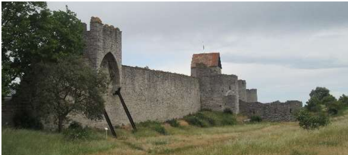
Visby középkori városfala

A középkori épületek mellett Visby természetesen rendelkezik egy barokk és egy századfordulós építési periódussal is, de ezekben az időszakokban már volt olyan mértékű a fejlődés és a város jelentősége, hogy a középkori hangulatot át tudta volna formálni. A városfalak körül megmaradt a glácisz, melyet meglepően természetközeli állapotban tartanak.