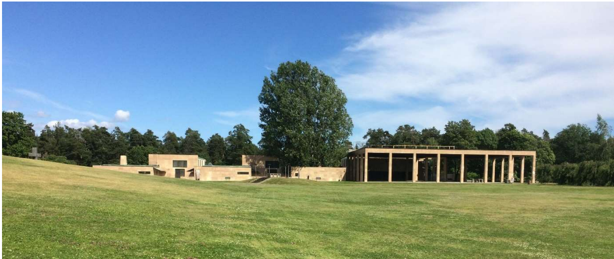
Sigurd Lewerentz és Gunnar Asplund ravatalozója

aligha, hiszen a térforma minden érzékszervvel való érzékelése mellett ehhez hozzá tartozik a jelen levő emberek mozgása, a hangok, az illatok térbeli érzékelése is.