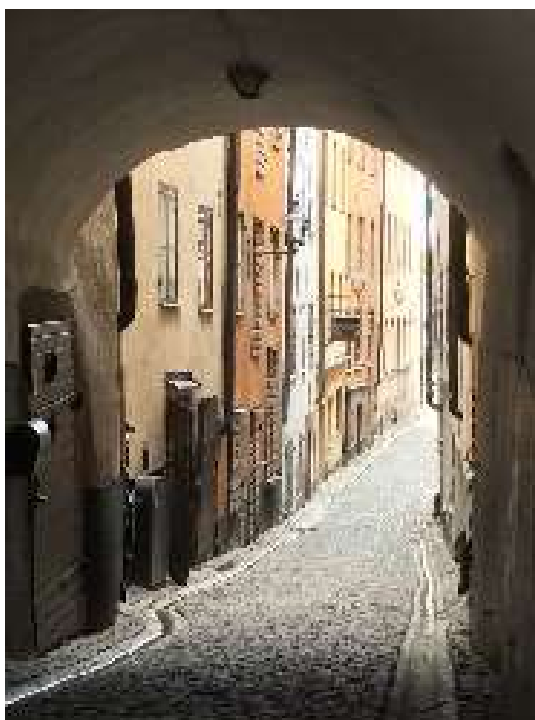
Jellegzetes Stockholm belvárosi utca

Utunkat a világörökségi címmel büszkélkedő temetőben, Skogskyrkogårdenben zártuk. A temető a XX. század első felében épült ki a város déli peremén egy faültetvény helyén, amelyet – úgy döntöttek – mégsem vágnak ki. Az öreg fenyőerdő fái között megbújó sírok sajátságosan festői látványt nyújtanak. A temető kiegészül sírok nélkül meghagyott markáns tájképi elemekkel is, amelyek valóban különleges helyé teszik.