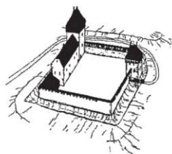
Castrum Bene konferencia