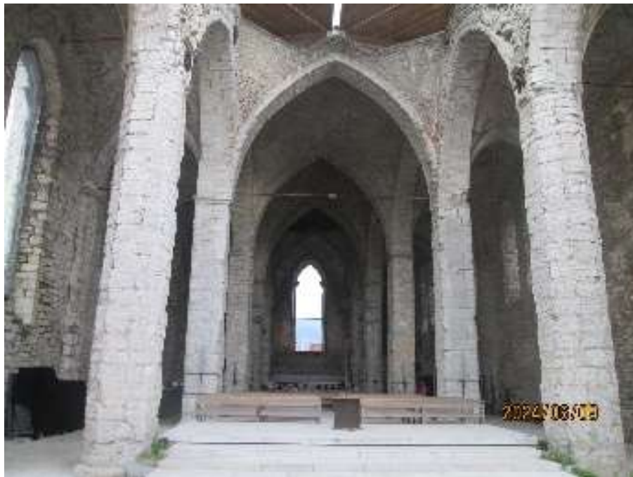
A St. Nicolai-templom belső tere

Műemléki szempontból talán a domonkosok Szent Miklós-temploma (Saint Nicolai) ébresztette a legtöbb gondolatot. A háromhajós teret négyzetes pillérek tagolják, a térlefedés különös falazási technikával készült csúcsíves keresztboltozat. Néhány hiányzó boltszakasz helyén modern faszerkezetű térlefedés található, az épület belsejében fedett-nyitott, félig szabadtéri rendezvényter került kialakításra. Funkcionális szempontból érdekessége, hogy a színpad a hajó nyugati végébe került, a használat iránya tehát átfordult az eredetihez képest. A berendezés mozgatható, a temperálást gázkombákkal oldották meg. A tér zártságát növeli, hogy az ablakok alsó harmada üvegezést kapott, a felső részen azonban szabadon áramlik a levegő. A templom díszítésének egykori gazdagságáról a földön elhelyezett faragványok adnak képet. A helyreállítás szemléletére jellemző, hogy nincsen minden részlet restaurálva, a „régiség érték” közvetlenül megtapasztalható az épületben.