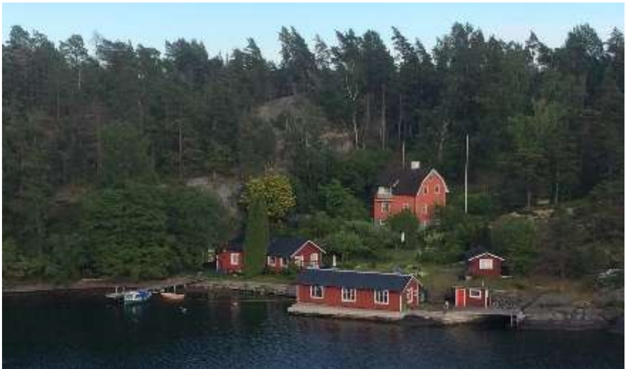
Hamisítatlan svéd táj: tenger, szigetvilág, piros faházak, sziklák, fenyvesek

A társaság egy része repülőgépen, másik része komppal tért vissza a szárazföldre. A három és fél óras hajóút eseménytelen volt, a svéd partokhoz közeledve apróbb szigetek között vitt a hajó útja, a szigeteken csoportosuló piros-fehérre festett házak tették változatossá és emberléptékűvé a tájat. Nynäshamn kikötővárostól még egy óras vonatút várt ránk Stockholmig. A hat részes villamos motorvonatok csatolt üzemben közlekednek 120-140 km/órás sebességgel, mintegy félórás ütemben.