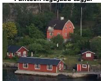
Európai Elnökök Találkozója Svédország, Visby, 2024. június 9-13.