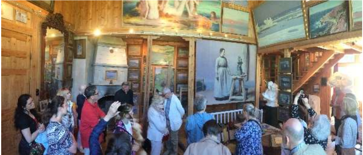
A Brucebo-villa meglátogatása

A társaság egy része repülőgépen, másik része komppal tért vissza a szárazföldre. A három és fél óras hajóút eseménytelen volt, a svéd partokhoz közeledve apróbb szigetek között vitt a hajó útja, a szigeteken csoportosuló piros-fehérre festett házak tették változatossá és emberléptékűvé a tájat. Nynäshamn kikötővárostól még egy óras vonatút várt ránk Stockholmig. A hat részes villamos motorvonatok csatolt üzemben közlekednek 120-140 km/órás sebességgel, mintegy félórás ütemben.