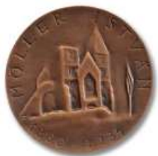
Möller István Emlékérem