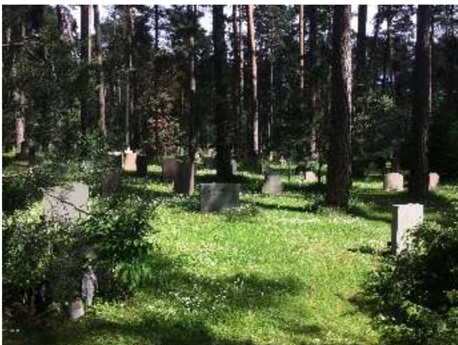
Hangulat az erdei temetőben

Utunkat a világörökségi címmel büszkélkedő temetőben, Skogskyrkogårdenben zártuk. A temető a XX. század első felében épült ki a város déli peremén egy faültetvény helyén, amelyet – úgy döntöttek – mégsem vágnak ki. Az öreg fenyőerdő fái között megbújó sírok sajátságosan festői látványt nyújtanak. A temető kiegészül sírok nélkül meghagyott markáns tájképi elemekkel is, amelyek valóban különleges helyé teszik.