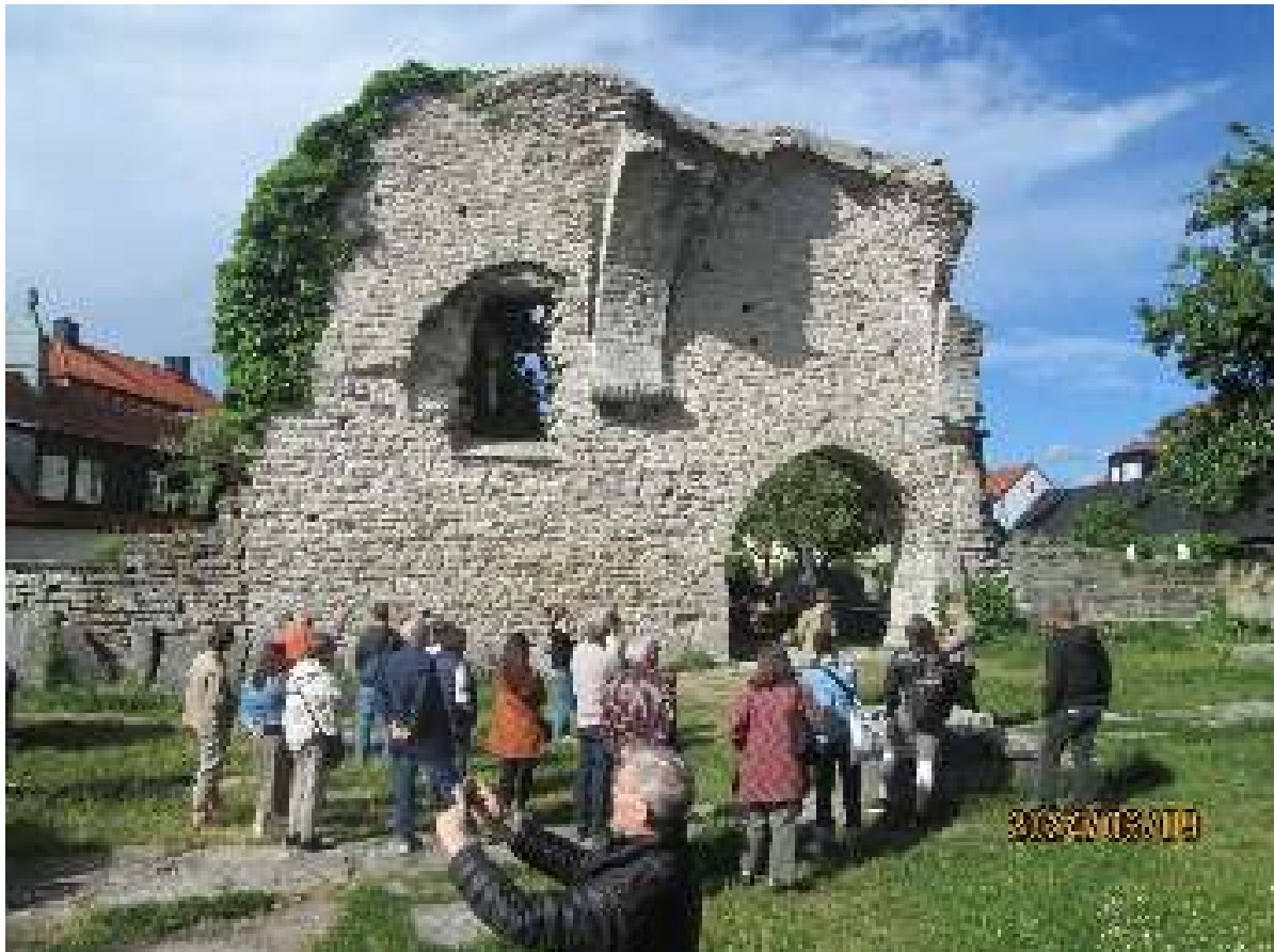
Az ICOMOS európai csoport látogatása az egyik templomromnál

Maga a program vasárnap délután kezdődött egy nem túl hosszú városi sétával, majd pedig a svéd nemzeti bizottság elnöke, Ulrika Mebus látott minket vendégül saját házában, tanúbizonyságát adva a saját és kollégái vendégszeretetének.