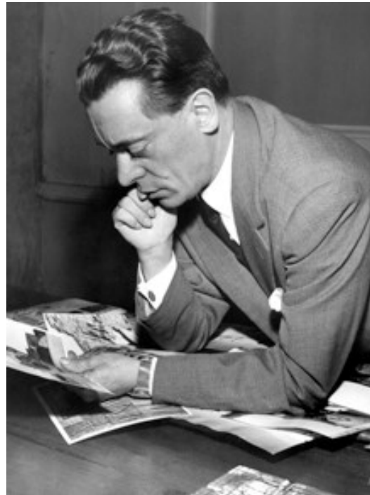
A nemzetközi műemlékvédelmi díj névadója Piero Gazzola