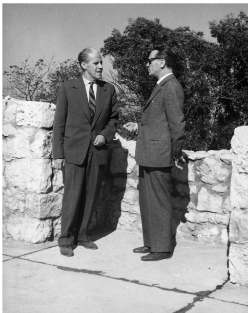
Piero Gazzola és Dercsényi Dezső az 1964-es budapesti konferencián (magántulajdon)

nemzetközi szervezetei sorába. Erre egy évvel a konferenciát követően Varsóban került sor, ahol az alakuló ülésen Gazzola az ICOMOS I. elnöke, Lemaire a főtitkára és Dercsényi Dezső a Végrehajtó Bizottság tagja lett. Még ezt megelőzően, a velencei konferencián bemutatott műemlék helyreállítási munkák sikerére alapozva, 1964 őszén, Budapesten nemzetközi konferenciára került sor a várak helyreállításának módszertani kérdéseiről, amelyen részt vett Gazzola és Lemaire is. Így a magyar műemléki gyakorlatot személyesen is megismerhették, amivel a hazai munka nemzetközi szintű elismertsége is növekedett.