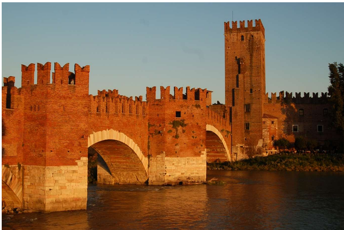
Verona, Castelvecchio-híd a háborús pusztítást követő helyreállítás után (fotó: Klaniczay Péter, 2007)

Piero Gazzola 1908. július 6-án született Piacenzában és a Verona melletti Negrar di Valpolicellában halt meg 1979. szeptember 14-én. 1932-ben szerzett építészmérnöki diplomát a milánói műegyetemen, majd 1934-ben irodalomból és filozófiából doktorált és 1936-ban paleográfiai és oklevéltani tanulmányokat is folytatott. 1939-től az építészettörténet és műemlékvédelem magántanára lett és 1941-ig Szicília keleti felének műemléki felügyelőjeként dolgozott Cataniában. Ezt követően több mint 30 évig, 1941 és 1973 között Veneto tartomány nyugati felének műemléki főfelügyelője volt Veronában. Emellett 1955-től haláláig a Régészeti és Képzőművészeti Főigazgatóság központi technikai felügyelője címet is viselte.