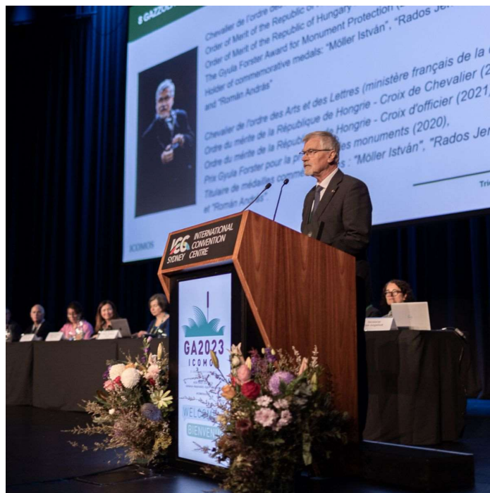
fotó: Kylie Christian, 2023