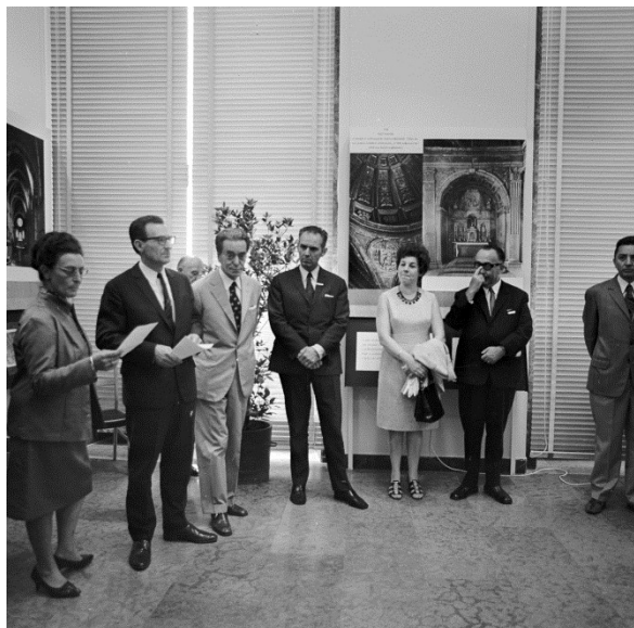
Piero Gazzola az ICOMOS III. kongresszusára rendezett kiállítás megnyitóján, 1972 (Mém-MDK Lymbus ICOMOS 1972-131N)

Születésének centenáriumának évében, 2008-ban, nagyszabású konferencián emlékeztek meg Veronában elméleti munkásságáról és mutatták be azt a fáradhatatlan életutat, ami az egész világot behálózó szakmai tevékenységgel tett hitet a műemlékvédelem egyetemes jelentősége mellett. Példát mutatott az elkövetkező generációk számára szakmai felkészültségéből, magas szintű értékítéletéből, kulturális sokszínűségéből, s ezzel végleg elfoglalta helyét Roberto Pane és Piero Sanpaolesi mellett a restaurálás és konzerválás olasz nagyjainak sorában.