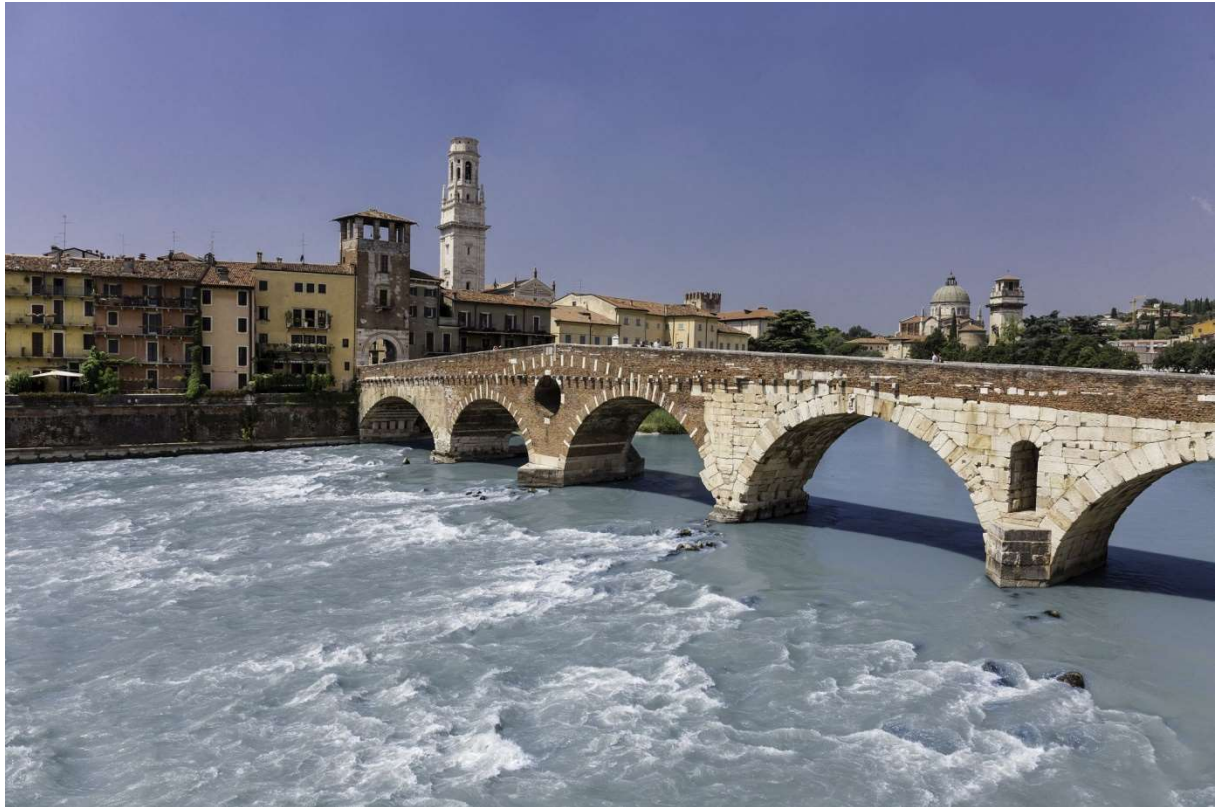
Verona, kőhíd (ponte Pietra) a háborús pusztítást követő helyreállítás után

módszerességgel, kiemelve és katalogizálva a folyóba hullott kőtömböket, amelyeket az eredeti kézműves technika alkalmazásával helyeztek vissza a helyükre, illetve a felületeknél a korabeli kezelésekkel érték el a történeti patina visszaállítását. Emellett Verona más fontos műemlékeinek konzerválásán és helyreállításán is dolgozott, köztük Sanmicheli palotáin és az Aréna konzerválásán, míg a környező területeken több mint 150 műemléki együttes megóvási és hasznosítási programját dolgozta ki.