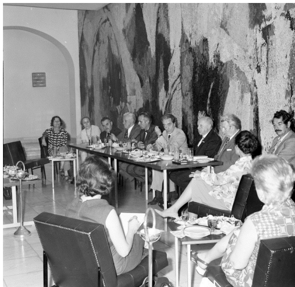
Piero Gazzola az ICOMOS III. kongresszusán tartott sajtótájékoztatót, 1972