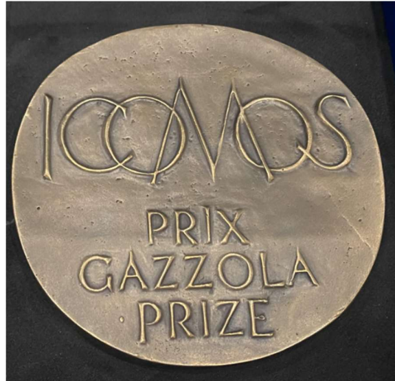
A Gazzola díj