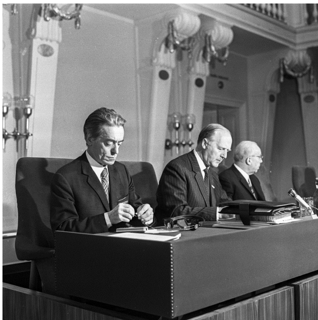
Piero Gazzola az ICOMOS III. kongresszusának nyitónapján, Budapesten, 1972 (Mém-MDK Lymbus (ICOMOS 1972-018N)

Az elkövetkező években még több találkozón is lehetővé vált a magyar és külföldi szakemberek álláspontjainak széleskörű kölcsönös megismerése és e kapcsolatoknak köszönhetően vált lehetővé, hogy az ICOMOS III. kongresszusát Magyarország rendezhette meg 1972-ben, az intézményes magyar műemlékvédelem centenárius évében. Gazzola megnyitó beszéde a már korábban látott itthoni műemléki gyakorlatról és a történeti városszövetbe integrálandó modern épületekről még inkább erősítette az addig véghezvitt magyar lépések helyességét. A többnapos rendezvényen kialakult szakmai és baráti kapcsolat tovább mélyítette a hazai és külföldi partneri viszonyokat, ami az elkövetkező évek elméleti munkáját és kétoldalú kapcsolatait is erősítette.