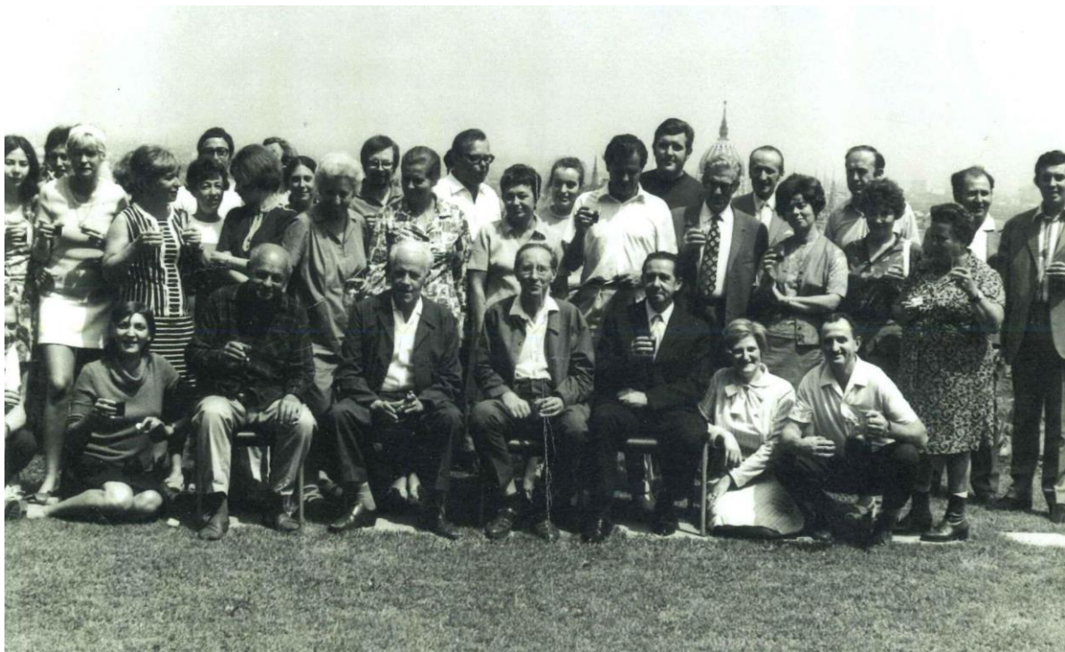
Csoportkép az 1970-es évekből