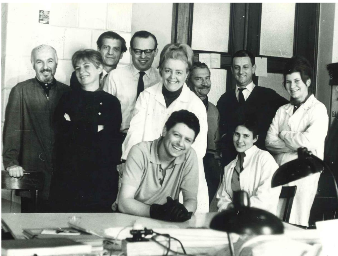
Néhányan a Tervezési Osztály tagjai közül az 1960-as években