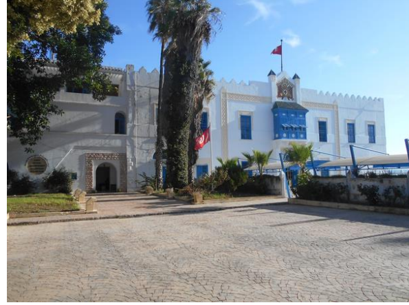
A konferencia helyszíne: a Régészeti Intézet

A rendezvénynek a Karthágói Akadémiai Régészeti Intézet adott helyszínt. A terem teljesen megtelt érdeklődőkkel. Bármennyire is volt meghirdetett témája a konferenciának, mégis jellemzően egy kérdéskör irányába mutatott a legtöbb előadás. A revitalizáció, a helyreállítás, a településfejlődés minden kérdése a hátsó mozgatóerővel, a turizmussal került összefüggésbe. Számos oldalról bemutatva ez olyannyira gazdasági alapkérdésévé vált, hogy annak profitorientált magatartása saját potenciálját képező műemléki környezeteket, műemlékeket képes teljesen megsemmisíteni. Valahogy minden előadás foglalkozott ezzel a kérdéssel, vagy mint következménnyel, vagy mint alapproblémával. A viták és a konferencia utáni beszélgetések során elég határozottan megfogalmazódott, hogy a CIVVIH-nek meg kell találnia a módját, hogy a konferencia tapasztalatai alapján felhívja a témakörre a maga szemszögéből is a figyelmet.