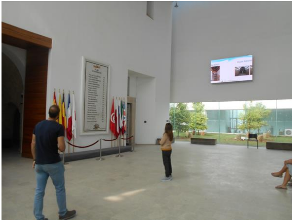
A Bardo Múzeum előcsarnoka a 2015-ös terrortámadás áldozatainak emléktáblájával

A CIVVIH közgyűlésének időpontját összehangolták az ICOMOS közgyűlésével, mert mindkettőt észak-afrikai ország vállalta megszervezni. Igen sokan voltak érdekeltek mindkét helyszínen. A szakbizottsági ülést érdemes volt csatlakoztatni, mert így lényegesen több tagország tudott megjelenni. Ez a szervezés különösen a tengeren túliak számára volt igen kedvező, sőt volt, aki a közgyűlés előtti casablancai 20. századi szakbizottság ülésén is részt vett. Ezt megelőzően a hagyományoknak megfelelően a CIVVIH Marrakechben, a közgyűléshez kapcsolódóan is megtartotta szokásos ülését, ahol a közgyűlésről érdeklődők is meghallgathatják a szakbizottság munkájának eredményeit. Öröndetes, hogy új tagország, Etiópia is csatlakozott itt a szervezethez.