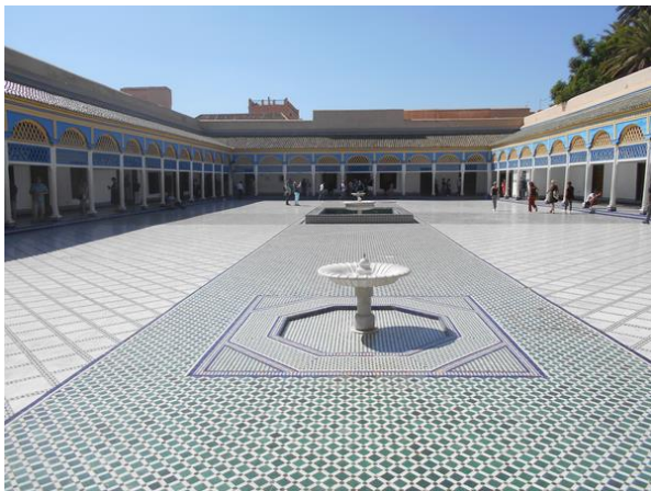
Bahia palota belső udvara a XIX. századból