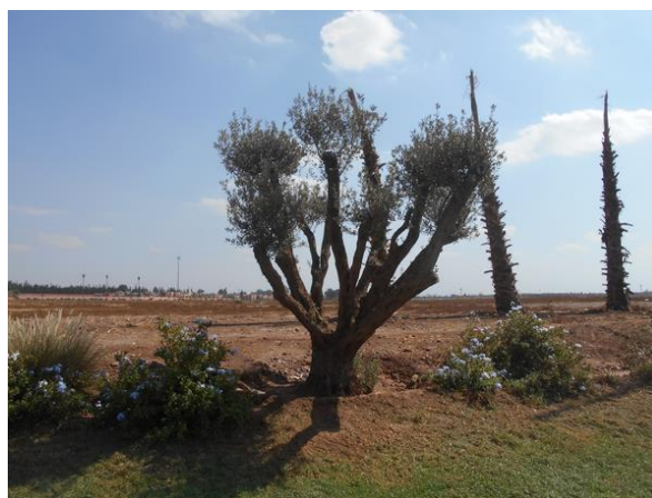
A konferencia helyszíne ... .. és környezete

Lehet, hogy pár év múlva a város legmodernebb negyedének itt lesz a központja, de ez a lehetőség most még nehezen volt érzékelhető. Az épület mai, de hűségesen követi az iszlám építészeti hagyományokat. A reprezentáció érdekében a részletektől sem sajnálták a költségeket.