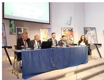
Beszámoló az ICOMOS Délkelet-Európai Regionális Üléséről - Kotor