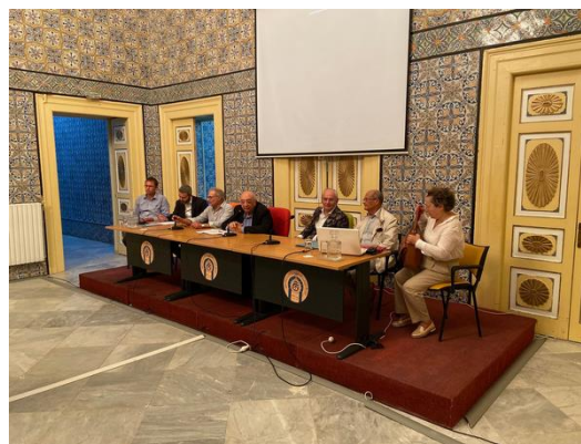
Beszámoló a CIVVIH Közgyűléséről - Tunisz