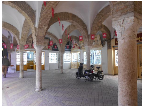
A hajdani rabszolgapiac ma az aranyüzletké

A rendezvény Tuniszban volt, pontosabban Karthágóban. Az ókori település a mai napig nem nőtt össze a fővárossal, tán a közbeékelődött repülőtér miatt soha nem is fog. Olyannyira nagyok a részek között a távolságok, hogy a szervezők fél napot arra áldoztak, hogy szervezett buszos túrával megmutassák a középkori Medinát a konferencia résztvevőinek.