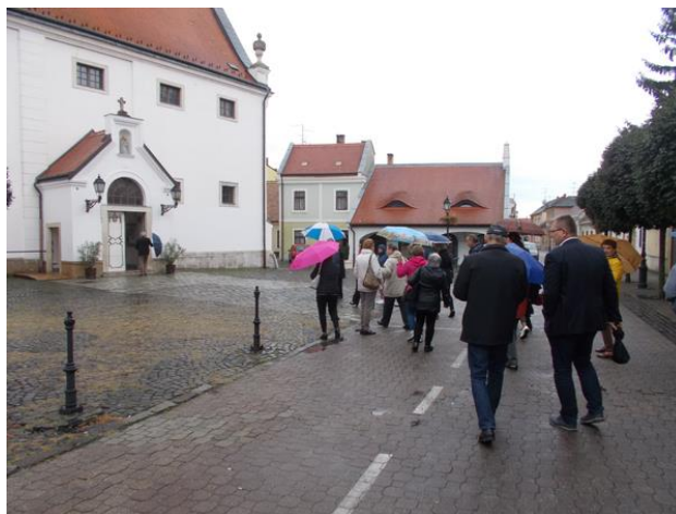
Városnéző séta a szemerkélő esőben

A tapasztalatcsere jövőre Várpalotán fog folytatódni.