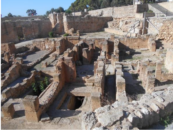
A római falak alatt a pun házakat is feltárták

A területnek csak kis töredéke van feltárva, állítólag már 15 cm-el a felszín alatt előjönnek a hajdan volt hatalmas római település maradványai. A tehetősebb rétegnek igen tetszik ez a magasabb fekvésű páratlan értékekkel rendelkező terület, állandóan próbálkoznak építési területet kiszakítani a védett helyszínből. Voltak, akik 10 évvel ezelőtt már jártak erre felé, azoknak feltűnt, hogy mennyire kiterjedt a lakóterület nagysága. Tehát itt sem pontosan úgy van, ahogy a helyi értékvédelem megkívánná.