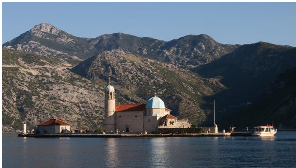
Madonna a Szirten

A Cattaroi-öböl szépségét már Jules Verne is megírta Sándor Mátyás című regényében: a helyet Európa, sőt az Óvilág legérdekesebb helyének nevezte. Erről győződhattünk meg a szombati hajóút során, amely Tivatból indult, és Kotorba érkezett.