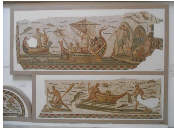
Páratlan római mozaikgyűjtemény a Bardo Múzeumban