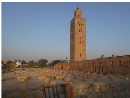
Beszámoló a ICOMOS Közgyűléséről - Marrakech

AZ ICOMOS MAGYAR NEMZETI BIZOTTSÁG FELHÍVÁSAI a 2020. évi ICOMOS DÍJRA, MŰEMLÉKVÉDELMI CITROM DÍJRA, PÉLDAADÓ MŰEMLÉKGONDOZÁSÉRT DÍJRA