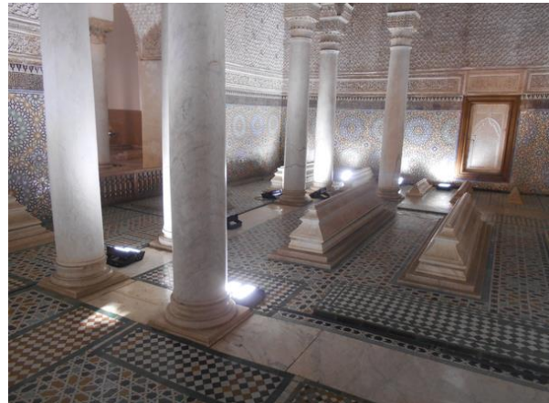
A szultánokat adó Saadian dinasztia temetkezési helye

Megtudhattuk, hogy az ICOMOS-nak 10513 főre emelkedett a taglétszáma. Új nemzeti bizottságok alakultak Comoreban, Elefántcsontparton, Montenegróban és Üzbegisztánban. Örömteli, hogy hat országában reménytelenül alakul a szervezet, sajnos öt fekete-afrikai országban pedig a bomlás szélére került a nemzeti bizottság. A legtöbb tagdíjat Franciaország, Ausztrália, Egyesült Államok és Németország fizeti.