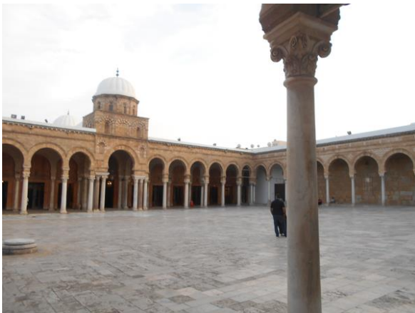
A Medinai Nagymecset