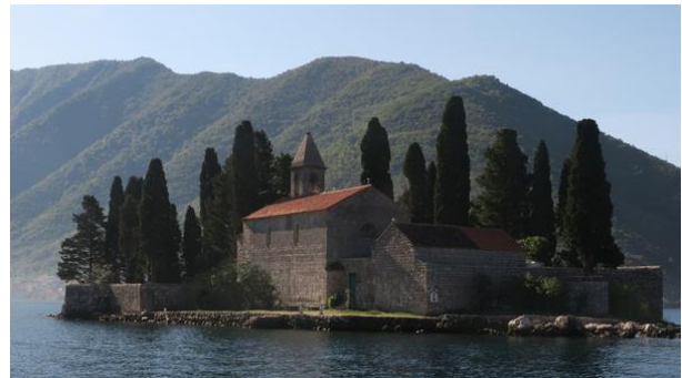
Szent György sziget

Útba ejtettük a Meredélyen álló Miasszonyunk-templomot is - Gospa od Škrpjela/Madonna dello Scarpello -, amely nevének megfelelően egy mesterséges szigetté alakított sziklaszirten áll kb. 1 méterrel a tengerszint felett. A rendkívül különleges és festői helyszín egymagában is indokolja, miért harcolnak a helybeliek a hatalmas, akár tízszintes óceánjárók behajózása ellen. A hegygerincekkel határolódó világörökségi helyszín kezelőinek amúgy is a turizmus fejlesztésének szabályozása, korlátozása a legfontosabb feladatuk és gondjuk. A 2006-ban önállósult, természeti látnivalókban bővelkedő, de iparral szinte nem rendelkező ország kitorési pontja elsődlegesen a turizmus.