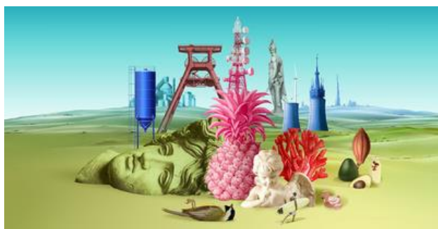
Beszámoló az 5. Közép-európai Örökségi Fórumról Krakkó