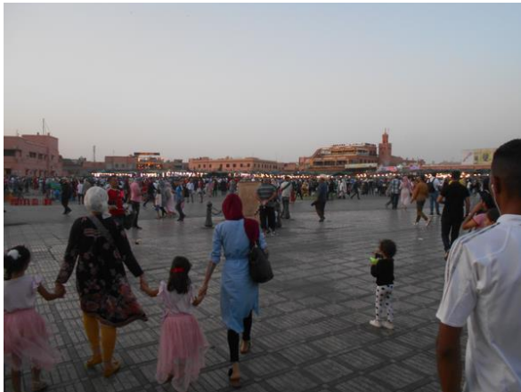
A központi piactér