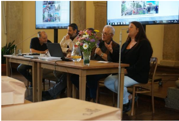
A Tanulmányi Központ előadótermében