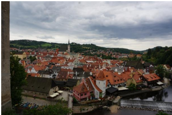
Český Krumlov – látkép