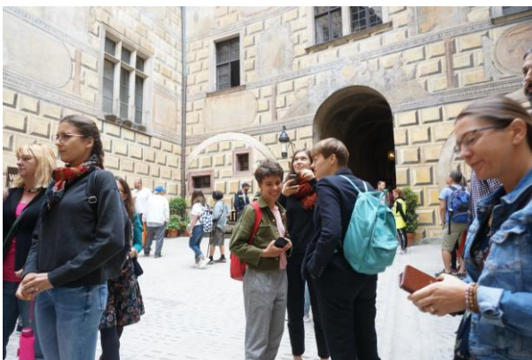
A Český Krumlov-i várkastélyban