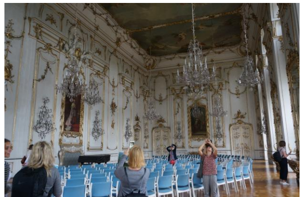
Kroměříž, a hercegérseki palota