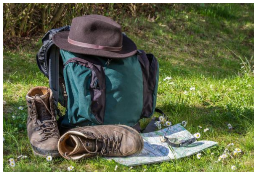
A bakancsos turistától a Citrom-díjig Gondolatok egy zempléni tanulmányút kapcsán