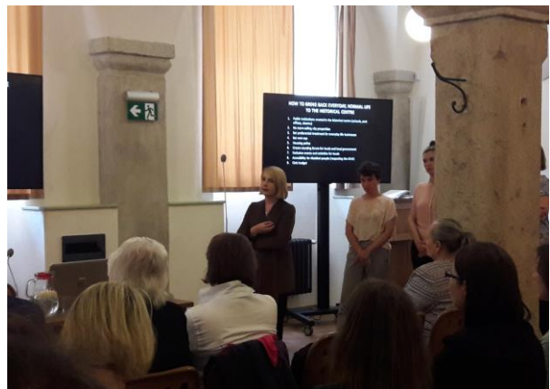
Prezentáció - #1 tematikus csoport