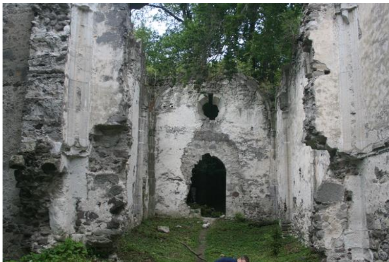
Gönc, pálos kolostor. Hiteles, autentikus – de vajon állni fog-e harminc év múlva?

Végül nézzünk meg egy műemléki szempontból teljesen hiteles romemléket, a gönci pálos kolostor romjait. A templom és szentély falai párkánymagasságig állnak, a kolostorból gyakorlatilag semmi sem látszik. Rengeteg faragott kő van beépítve és hever szerteszéjjel, az egészre ránőve az erdő, igazán festői hely.