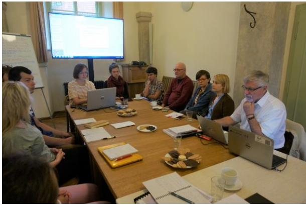
Workshop - #1 tematikus csoport