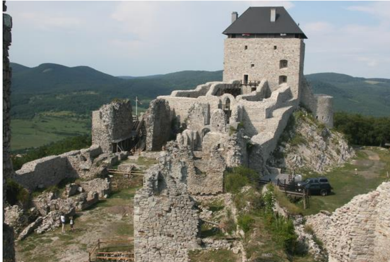
Regéc újjáépített öregtornya

Regéc esetében már továbbmegy a kiépítés: itt már felépült egy téglalap alaprajzú torony a füzériekhez hasonló módon megalkotott enteriőrökkel, kívülről azonban vakolatlanul, így jobban illeszkedve a vár – még feltárás alatt levő – rom jellegéhez.