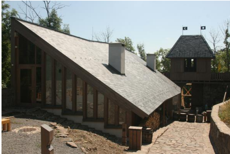
A fogadóépület tömegével utal a történeti épületekre, de részleteit tekintve ugyanakkor kortárs, szép épület is egyben

Ugyanakkor a vár fogadóépülete tömegével utal az egykor itt állott félnyeregvetős épületekre és felidézi a kaputorony lehetséges formáját, de részletmegoldásaiban, homlokzatképzésével – vagyis azokon a helyeken, ahol a történeti ismeretek hiányoznak – kortárs építészeti eszközöket használ.