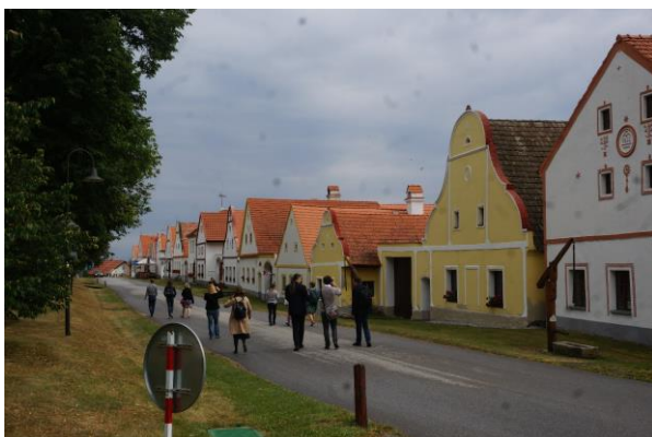
Holašovice - vernakuláris barokk világörökség