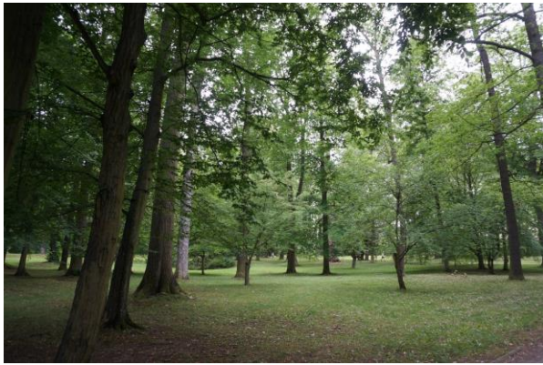
Český Krumlov – a kastélykertben