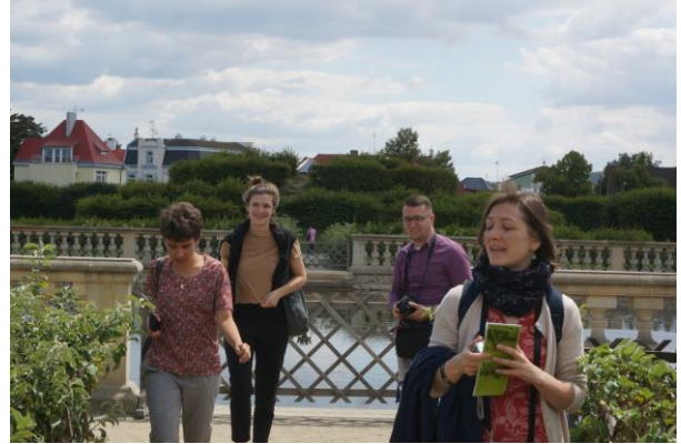
Kroměříž, a Virágos Kert