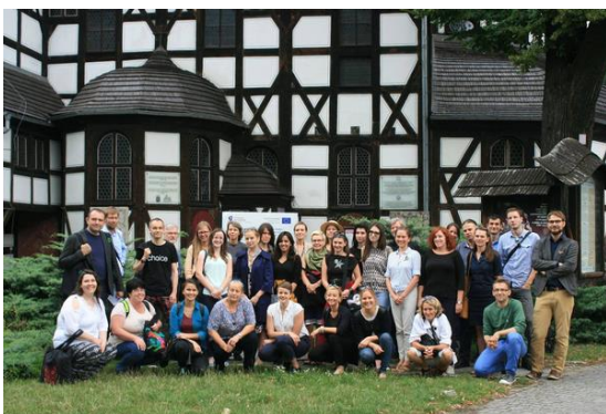
V4 Summer Academy – Krakó - Český Krumlov