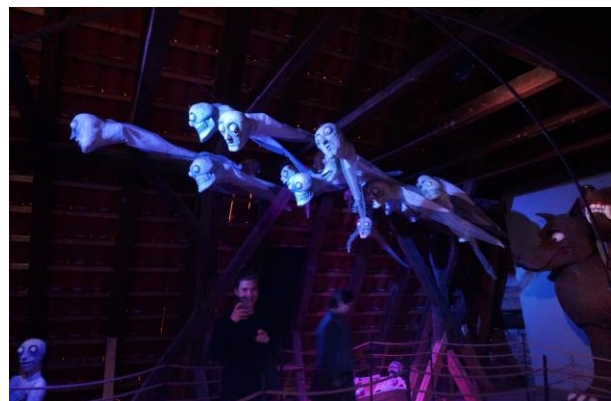
Český Krumlov – „danse macabre” a ferences kolostor tetőterében