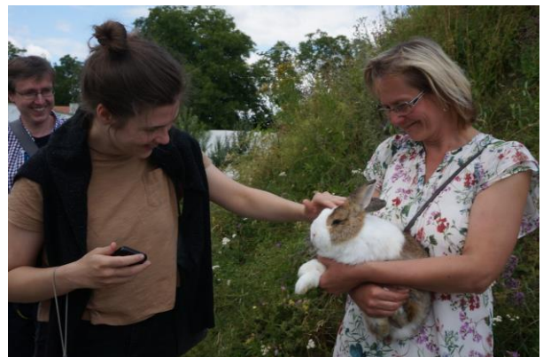
Kroměříž, a Virágos Kert