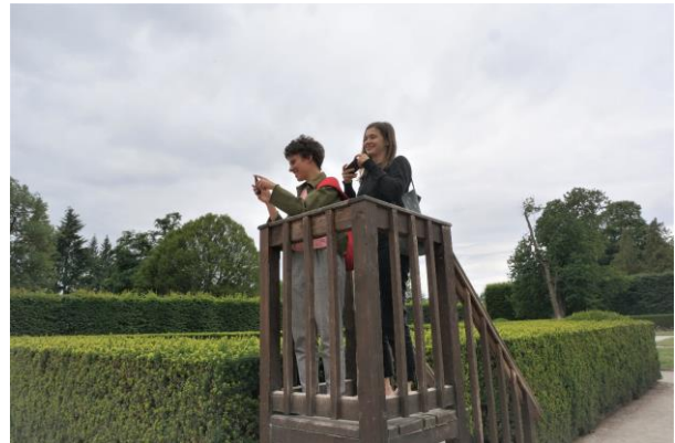
Český Krumlov – a kastélykertben