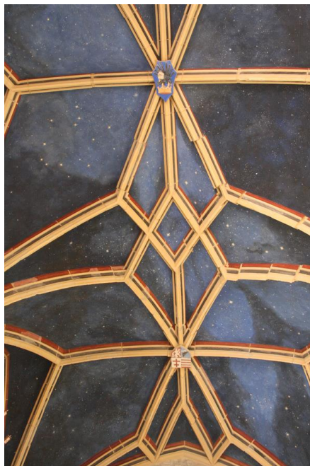
A kápolna rekonstruált boltozata. A bordák eltolt vissza(?)helyezése érzékelteti, hogy nem eredeti szerkezetről van szó, a mennyezeti festés a középkori színvilágot megidéző kortárs képzőművészeti alkotás

Talán a kápolna tere az egyetlen, ahol a boltozati bordák eltolt elhelyezése – zseniális megoldásként – utal arra, hogy itt nem eredeti boltozatról, hanem a teret megidéző rekonstrukcióról van szó. A figyelmes szemlélő a boltozati festésről is meg tudja állapítani, hogy egy kortárs díszítőfestésről van szó, bár erre vonatkozó tájékoztatás a helyszínen nincs.