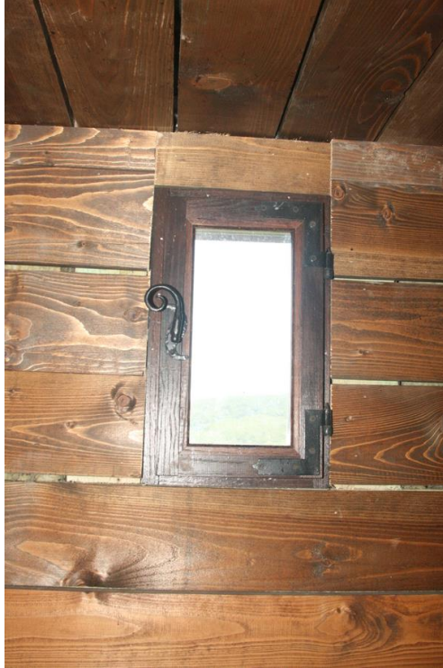
A kilincs és a pipapánt historizál, de a csavaros rögzítés modern

Füzéren az épület részleteinek (ajtók, ablakok, padlóburkolatok, felületképzések) anyaghasználata ugyan teljes mértékben megfelel a korabelinek, ugyanakkor a teljes (nagy kérdés, hogy hol húzzuk meg a határt a rekonstrukció és az új építészeti alkotás között?) rekonstrukció igénye már nem tud megvalósulni, mert az egyes elemek, ajtópántok, vasalatok csillagfejű csavarokkal vannak rögzítve, a megsérült vakolatból kikandikálnak a vakolaterősítő hálók, a termék korszerű világítása, mint történeti előkép nélküli elem megpróbál rejtetten megjelenni, de a kiforduló falsíkok mégis az enteriőrök részévé válnak.