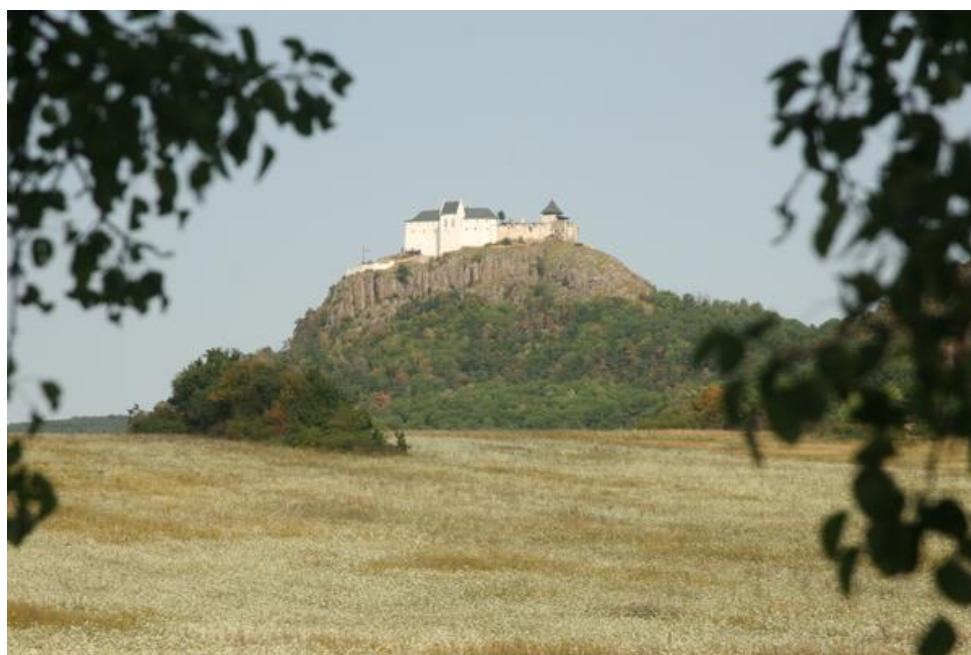
Nem kétséges, hogy a felépített vár több tíz kilométeres körzetben vált a táj hangsúlyos, festői elemévé

A füzéri vár felújításának (a romok megóvásának? kiépítésének?) története száz évre nyúlik vissza, többször, többféle, egyre nagyobb léptékű beavatkozások történtek, melyeket ugyanaz a cél vezetett: az értékesnek ítélt maradványok megóvása és az értékek bemutatása.