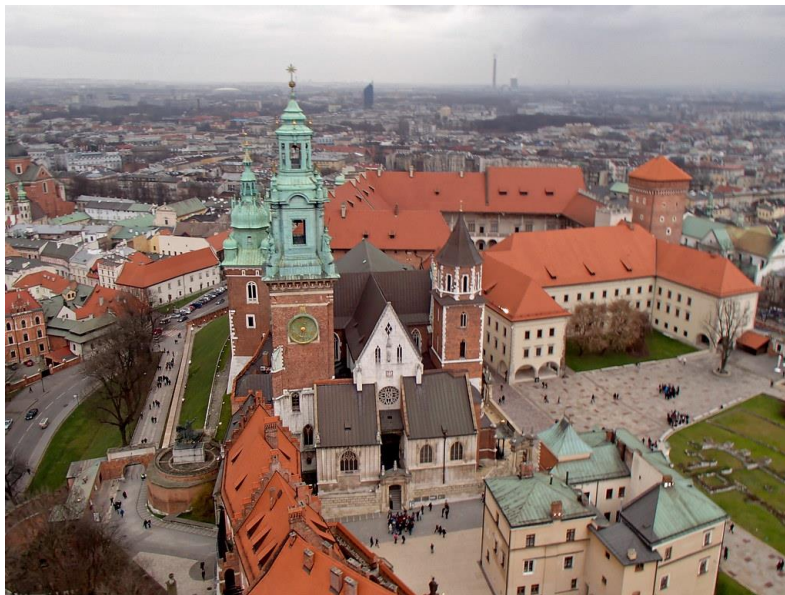
Krakkó, a Wawel