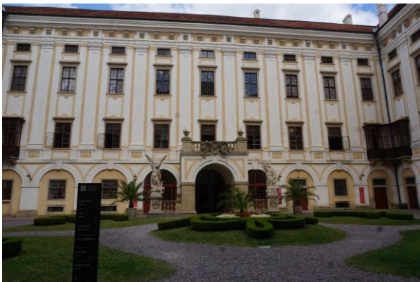
Kroměříž, a hercegérseki palota