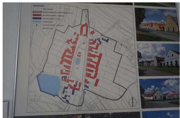
Holašovice - vernakuláris barokk világörökség