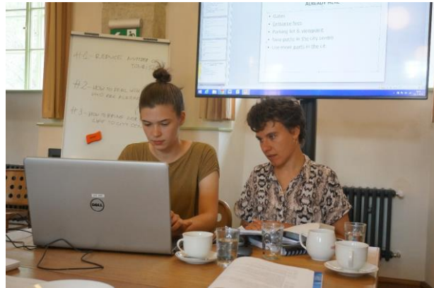
Workshop - #1 tematikus csoport