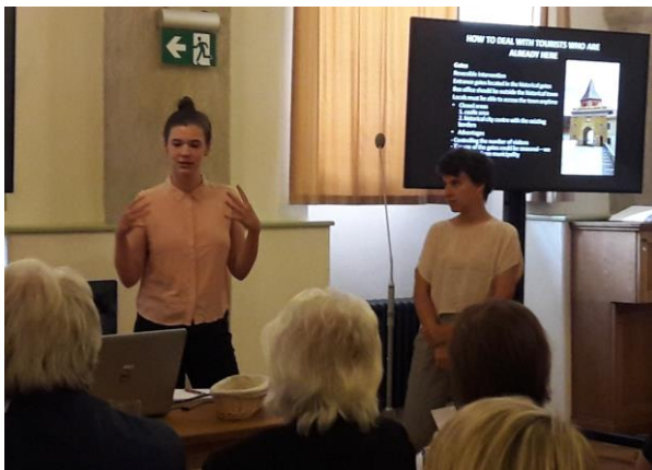
Prezentáció - #1 tematikus csoport