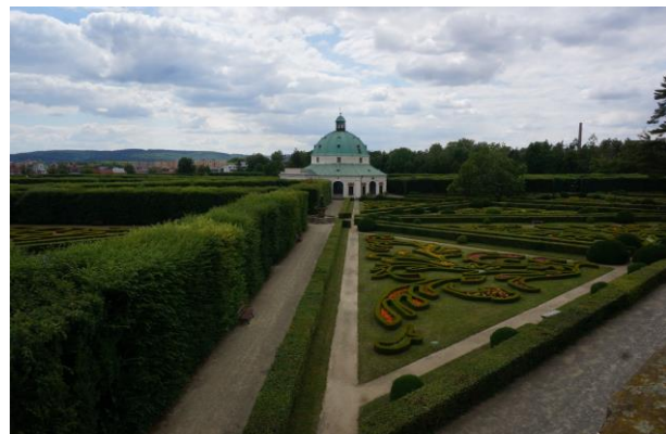
Kroměříž, a Virágos Kert