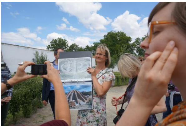
Kroměříž, a Virágos Kert