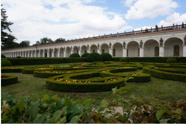
Kroměříž, a Virágos Kert