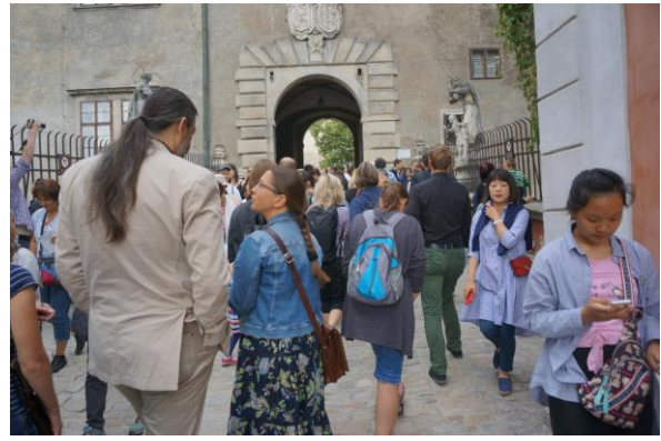
A Český Krumlov-i várkastélyban