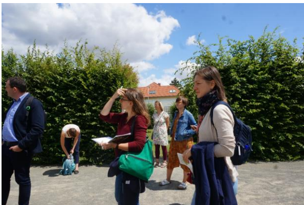
Kroměříž, a Virágos Kert