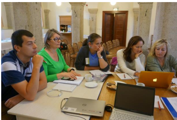
Workshop - #1 tematikus csoport