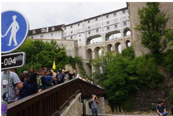
Český Krumlov – látkép turistákkal