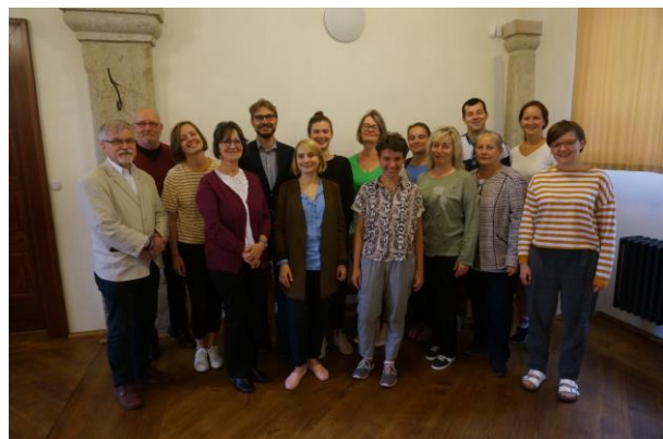
Workshop - #1 tematikus csoport