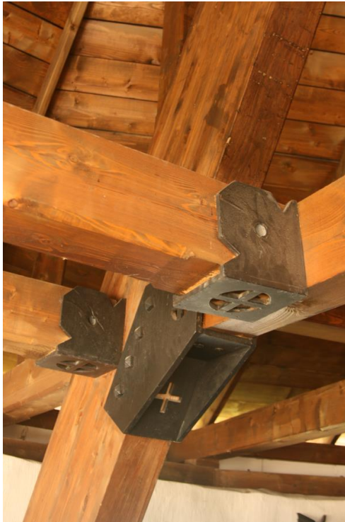
Modern tetőszerkezet historizáló stílusú mérnöki kötőelemekkel

ugyanakkor ez az elv nem vonul végig következetesen az egész épületen, hiszen a tetőszerkezet és a tetőtérben kialakított tér egyértelműen mai felfogású – bár itt éppen a korszerű mérnöki szerkezet acél kapcsolóelemei kapnak soha nem volt történeti díszítőformát.