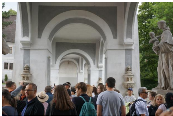
A Český Krumlov-i várkastélyban