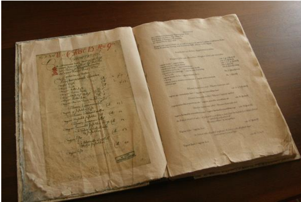
A kiállításban eredeti és olvasható formában egyaránt bemutatásra kerül a XVII. századi leltár, ami megalapozza a berendezés hitelességét

Az egyik szobában a leltárak is olvashatók egy vaskos könyvvé összefűzve: bal oldalon az eredeti, jobb oldalon a nyomtatott betűkkel átírt, illetve mai nyelven megfogalmazott változat, tehát ha a turista veszi a fáradságot maga is végezhet forráskutatást, illetve ellenőrizheti a látottakat.