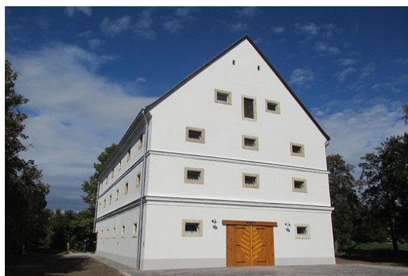
Az ICOMOS Magyar Nemzeti Bizottság XXVIII., Tisztújító Közgyűlése – Budajenő