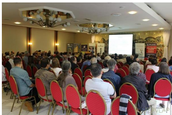
Érték, változás, közösség: Európa az örökségvédelem tükrében Konferencia beszámoló