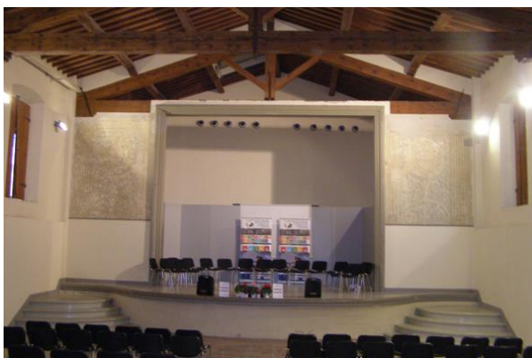
a konferencia helyszíne, a Teatro Lorenese belseje