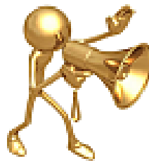
2018-as Díjainkra január 8-ig várjuk javaslatokat!