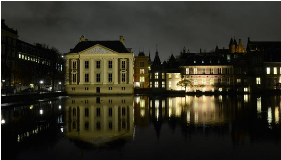
A Mauritshuis és a Binnenhof a tó felől

A konferencia végeztével fölkeresett szomszédos Mauritshuis kicsi, de színvonalas gyűjteményéről nevezetes; elég Vermeer gyöngyfülbavalós lányára, vagy Rembrandt Tulp doktorára utalni. Műemléki szempontból nemcsak a Jacob van Campen által tervezett, jól ismert, 17. század közepi épület figyelemre méltó, hanem a múzeum közelmúltban elkészült bővítése is. Ez a föld alatt készült el, így létrehozva a múzeum működéséhez szükséges tágas előcsarnokot, üzletet, vendéglátóhelyet, egyúttal hozzákötve a keskeny utca túloldalán lévő épületet is, amely így időszakos kiállítások megrendezését is lehetővé teszi. Ez a megoldás úgy tudta jelentősen kibővíteni az eredeti épületet, hogy az kívülről teljesen érintetlen tudott maradni. (Hasonló, példaként szolgálható hozzáállást tapasztalhattam az amszterdami Amstelkring múzeumépülete és a Rembrandt-ház esetében is: az eredeti műemléképületeken beavatkozás nem látszik, az új tereket alatta, mellette hozták létre).