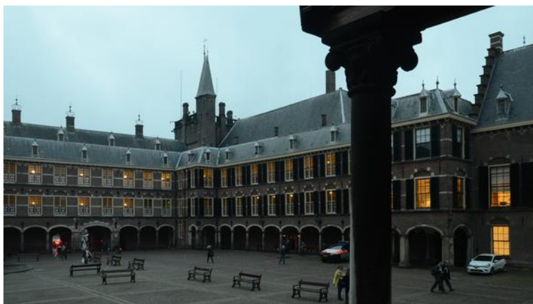
A Szenátus épületszárnya a Binnenhofban

A megbeszélésnek helyt adó, a Binnenhofban lévő holland Szenátus épülete szerénységével hívta fel magára a figyelmet. A Szenátus voltaképpen a kétkamarás holland országgyűlés egyik háza. Ennek ellenére a bejárata a város egyik forgalmas gyalogútként is működő udvar árkádjai alatt nyílik, és ennek mérete nem nagyobb egy lakás ajtajánál.