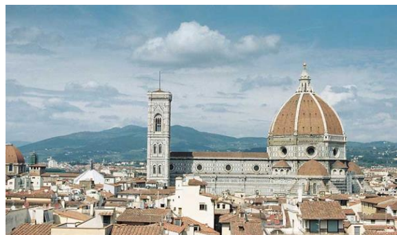
Európai ICOMOS Nemzeti Bizottságok elnökeinek találkozója - Firenze