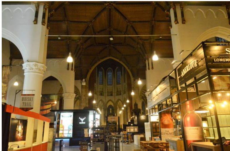
készülő whisky-kiállítás a Grote Kerkben