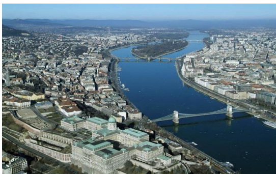
Sajtóközlemény Budapest világörökségi helyszínné nyilvánításának 30. évfordulója alkalmából