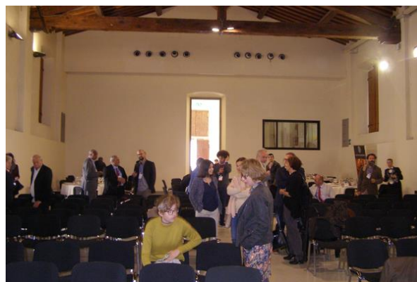
a konferencia szünetében

A kerekasztal konzultációt Jukka Jokilehto, az ICCROM korábbi igazgatója, az ICOMOS tiszteletbeli tagja vezette. Hangsúlyozta az ICOMOS fontosságát az UNESCO konvenció érvényességét különösen a Krakkói karta tükrében, hiszen az ICOMOS az UNESCO nemzetközi konvenciója. Tehát a problémák nem csak az ICOMOS-t érintik, de egyben generális kérdések is. Új terminusok jelentek meg, mint pl. a kulturális táj fogalma.