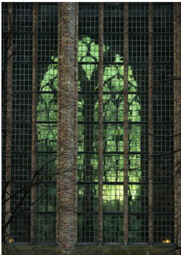
A Grote Kerk szentélyének ablakai

Lényegesen furcsább benyomást szerezhettem a hágai Grote Kerk esetében. Az eredetileg Szt. Jakab, majd protestánssá lett, nevének megfelelően valóban igen nagy templom a téglagótika és a későbbi faboltozat nagyszerű példája; ezért is kerestem fel. A szentély felől nyíló nagy ajtón belépve igen furcsa látvány tárult elém: míg az épület megőrizte orgonáját, szószékét, stallumait és egyéb értékes berendezési tárgyait, az enteriőrben éppen egy nagyszabású whisky-bemutató és vásár előkészületei folytak, pragmatikus módon, erősen eltávolodva az eredeti szakrális funkciótól.