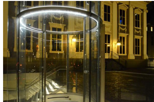
A Mauritshuis új bejárata és üvegliftje

Lényegesen furcsább benyomást szerezhettem a hágai Grote Kerk esetében. Az eredetileg Szt. Jakab, majd protestánssá lett, nevének megfelelően valóban igen nagy templom a téglagótika és a későbbi faboltozat nagyszerű példája; ezért is kerestem fel. A szentély felől nyíló nagy ajtón belépve igen furcsa látvány tárult elém: míg az épület megőrizte orgonáját, szószékét, stallumait és egyéb értékes berendezési tárgyait, az enteriőrben éppen egy nagyszabású whisky-bemutató és vásár előkészületei folytak, pragmatikus módon, erősen eltávolodva az eredeti szakrális funkciótól.