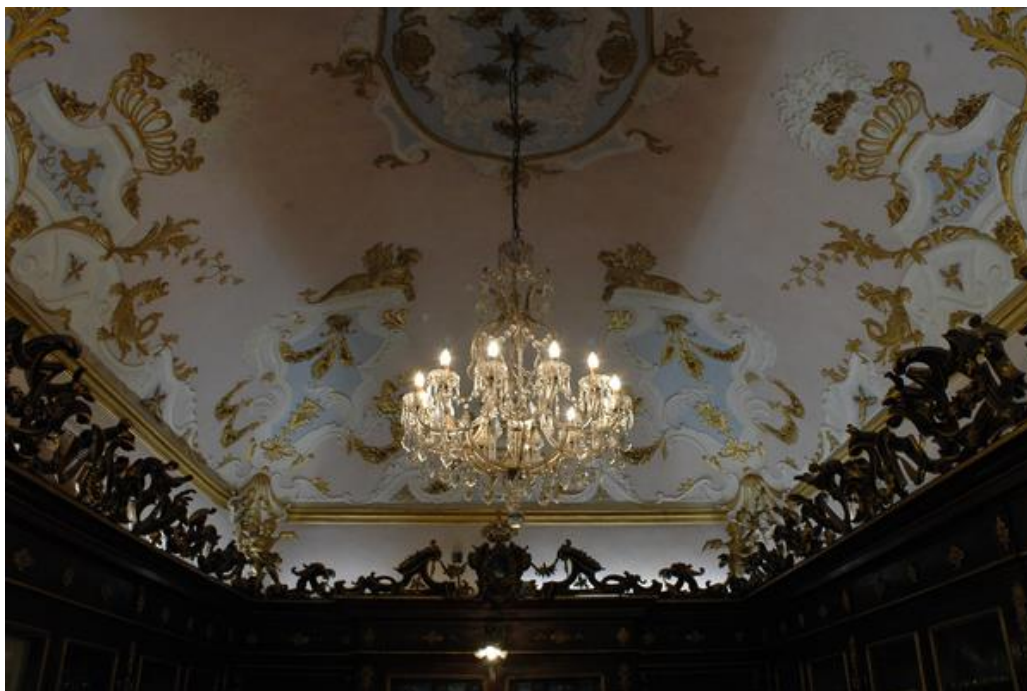
a manufaktúra barokk boltozata

A manufaktúrából az 1288-ban alapított Santa Maria Nuova kórház felújított és részben múzeummá alakított szárnyába és kápolnájába látogattunk el, s a valóságban is megtapasztaltuk, hogy az aprólékos munkával helyreállított részletek hogyan egyeztethetők össze a teljesen más igényeket kívánó kórházi funkcióval.