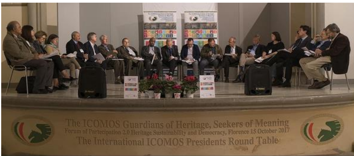
a kerekasztal résztvevői

A kerekasztal konzultációt Jukka Jokilehto, az ICCROM korábbi igazgatója, az ICOMOS tiszteletbeli tagja vezette. Hangsúlyozta az ICOMOS fontosságát az UNESCO konvenció érvényességét különösen a Krakkói karta tükrében, hiszen az ICOMOS az UNESCO nemzetközi konvenciója. Tehát a problémák nem csak az ICOMOS-t érintik, de egyben generális kérdések is. Új terminusok jelentek meg, mint pl. a kulturális táj fogalma.