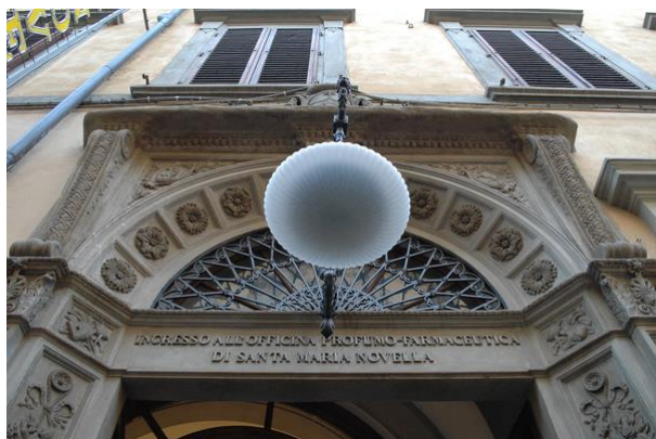
a Santa Maria Novella Illat és Gyógyszer manufaktúra

Ezt követően a résztvevők a Santa Maria Novella kolostor együttesében már több évszázada működő illat és kozmetikai termékek előállítását és forgalmazását végző manufaktúrát látogatták meg, ahol évszázados módszereket, berendezési tárgyakat és nem utolsósorban egészen rendkívüli termékek megtekintésére és illatok érzékelésére nyílt mód.