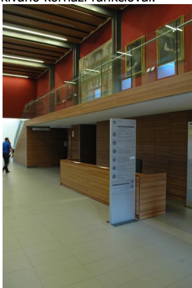
Santa Maria Nuova kórház bejárat

A manufaktúrából az 1288-ban alapított Santa Maria Nuova kórház felújított és részben múzeummá alakított szárnyába és kápolnájába látogattunk el, s a valóságban is megtapasztaltuk, hogy az aprólékos munkával helyreállított részletek hogyan egyeztethetők össze a teljesen más igényeket kívánó kórházi funkcióval.