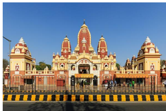
Előzetes gyorsjelentés az ICOMOS 19-ik közgyűléséről - Delhi