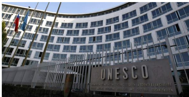
Az UNESCO Világörökség Bizottság 2017-től belépő tagjainak megválasztásáról