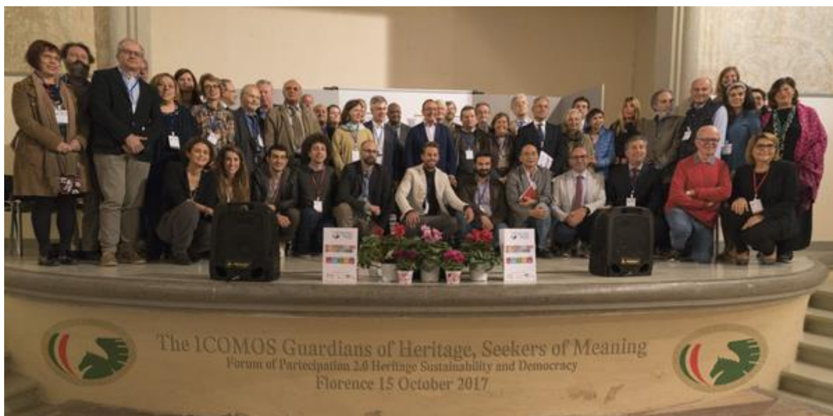
a fórum résztvevői

Vendéglátóként, Pietro Laureano megemlítette, hogy nemzetközi segítségek igénybevételét elősegítő stratégiát kell kidolgozni, amihez jó példaként hozta fel Sassi di Matera példáját, ami világörökségi listára került és részben meg is változott, de a kultúra, mint összetartó erő tovább élteni.