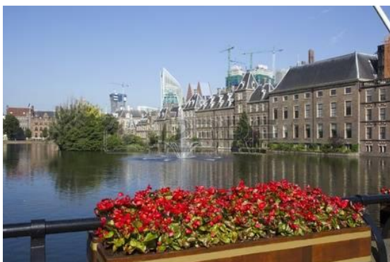
Beszámoló az Europa Nostra találkozójáról - Hága