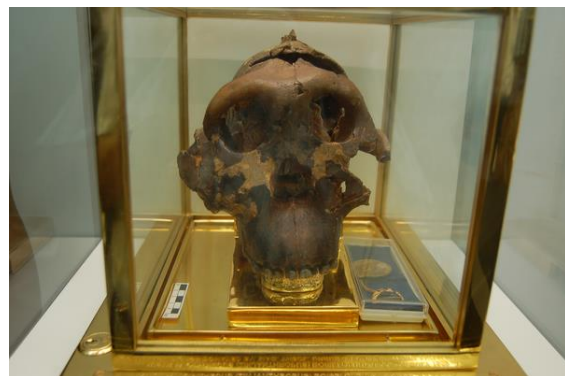
Az 1,84 millió éves Paranthropus boisei 515 cm 3 űrtartalmú koponyája, Olduvai hasadék (1959)