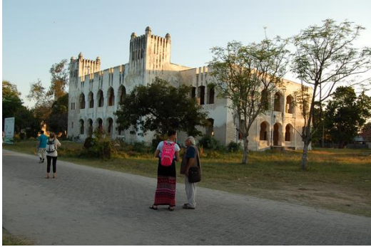
A német kormányzói palota, Bagamoyo