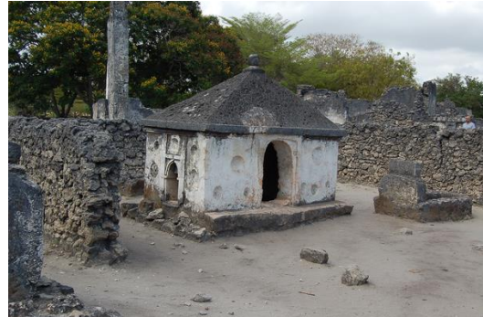
13-15. századi muzulmán sírok, Kaole