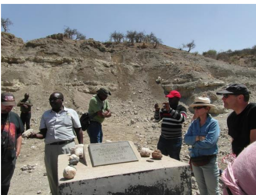
A Paranthropus boisei (Australopithecus boisei) lelőhelyét megjelölő tábla