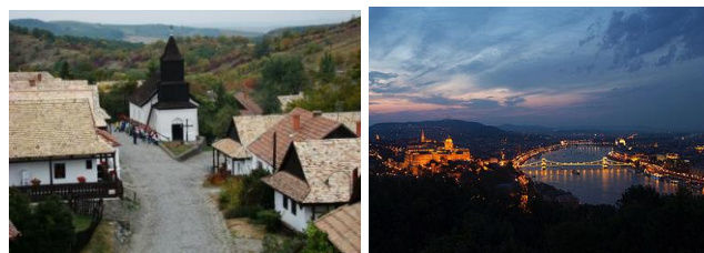
30 éve Világörökség !

AZ ICOMOS MAGYAR NEMZETI BIZOTTSÁG FELHÍVÁSAI A 2018. évi ICOMOS DÍJRA, MŰEMLÉKVÉDELMI CITROM DÍJRA, PÉLDAADÓ MŰEMLÉKGONDORZÁSÉRT DÍJRA