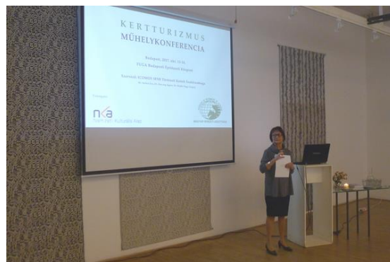
Kertturizmus műhelykonferencia és szakmai kirándulás 2017 október 13-14