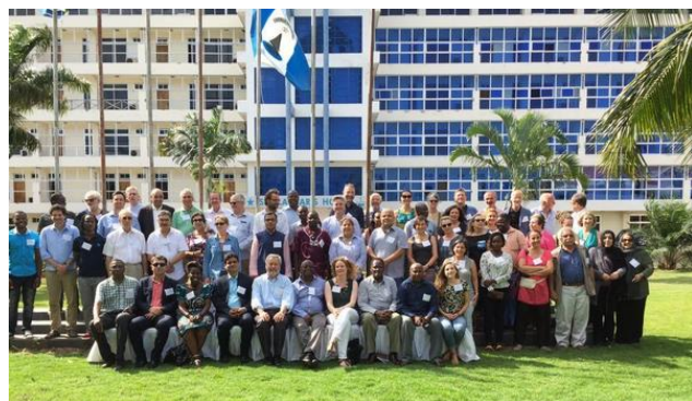
Beszámoló az ICAHM éves üléséről Bagamoyo /Tanzánia/