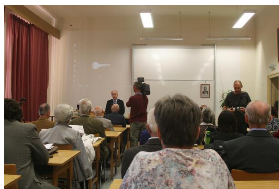
Kortárs építészettörténet III. Konferencia Kubinszky Mihály emlékére