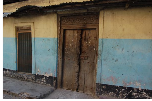
Díszesen faragott 19. századi ajtókeret, Bagamoyo