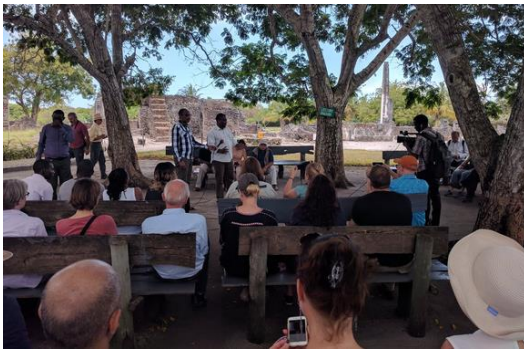
A konferencia szakmai kirándulása, Kaole romjainál