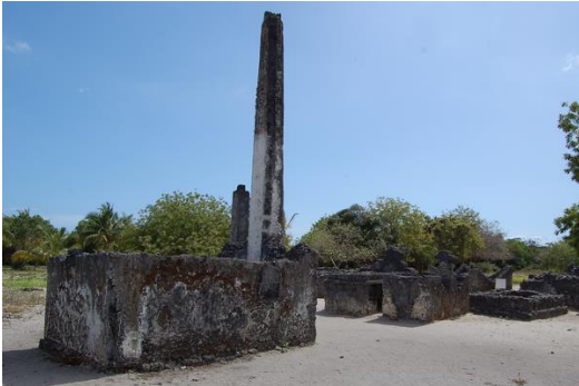
13-15. századi muzulmán sírok, Kaole