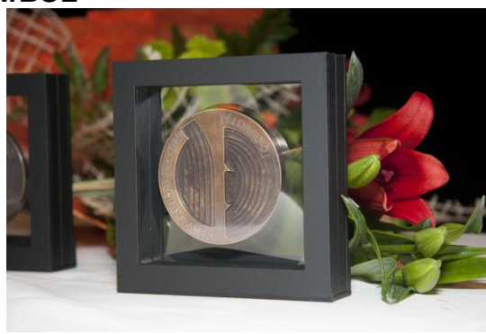
ICOMOS Díjak, Példaadó Műemlékgondozásért Díjak 2015