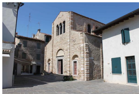
Alpok-Adria Munkacsoport ülés - Grado beszámoló