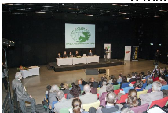
Műemléki Világnap - 2015 Várkert Bazár-Budapest