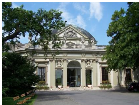
Meghívó az ICOMOS Magyar nemzeti Bizottság XXV., Tisztújító Közgyűlésére