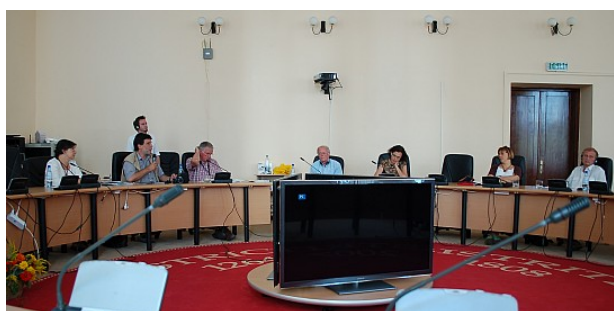
16. Tuszád konferencia - Beszterce