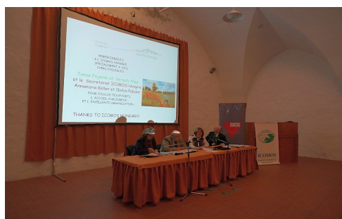
30 éves jubileumi CIVVIH ülés – Budapest/Visegrád