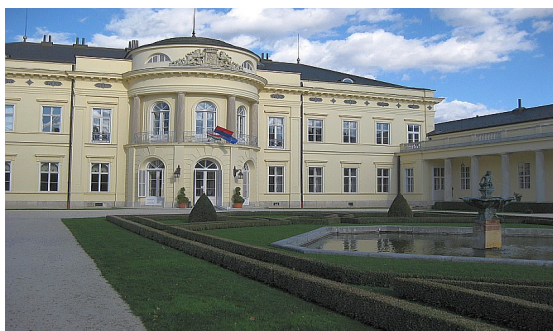
„Védett épületek a fogyatékossgal élők szolgálatában” - Konferencia Fehérvárcsurgón