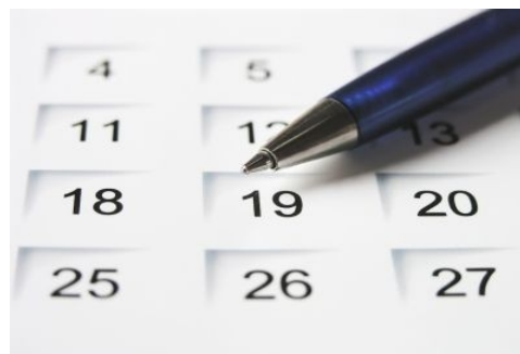
Emlékezünk rá, hogy... Rejtett évfordulóink