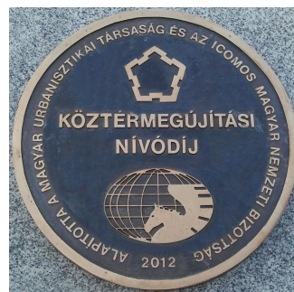
Köztérmeújítási Nívódíjak 2013