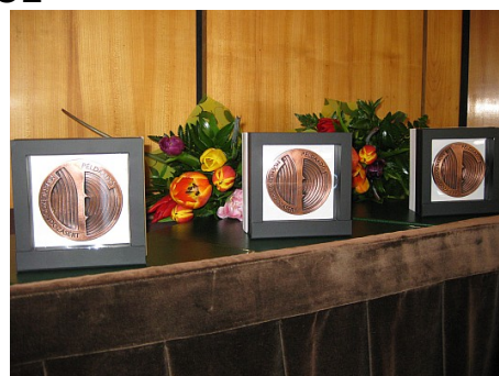
Először osztottuk ki az ICOMOS Példaadó Műemlékgondozásért díját