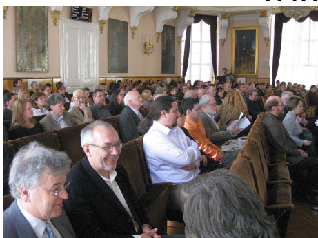
Műemléki Világnap – 2013. április 18.