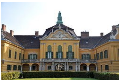
A Nagytétényi Kastélymúzeum a római Campona területén