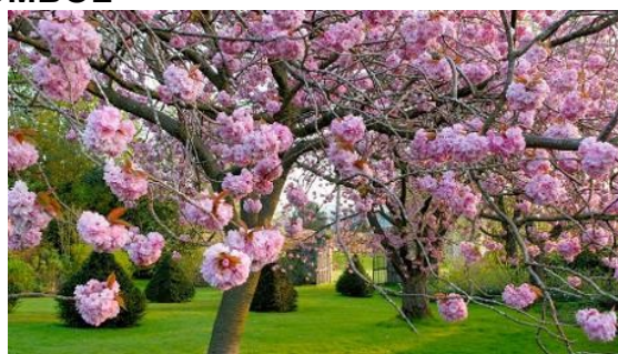
Történeti Kertek Szakbizottságának hírei