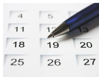
Emlékezünk rá, hogy... Rejtett évfordulóink