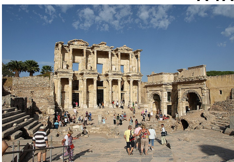
Egy turistaúton – hazafelé gondolva...