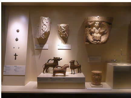
Fény és árnyék– A Főváros 1000 éves története Látogatás a BTM kiállításán