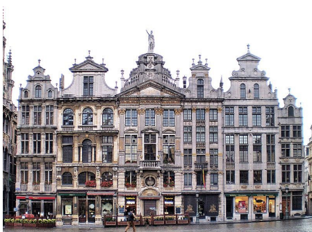
ICOMOS európai elnökök találkozója volt Brüsszelben - beszámoló