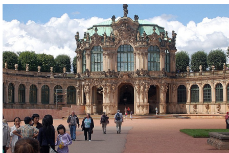
Műemlékes szemmel Szászországban 2012