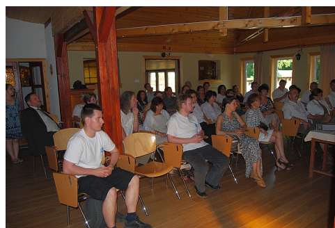
Beszámoló a 42. Román András Műemlékvédelmi Nyári Egyetemről