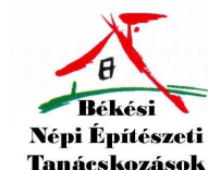
Ki van itthon? címmel