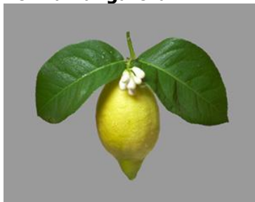
a Heritage at Risk-ben és idehaza...

“Citrus varietas icomos forma hungarorum”