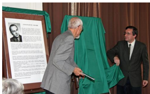
ICOMOS Műemlékvédelmi Panteon

“Citrus varietas icomos forma hungarorum”