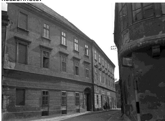
fotó: Diebold Károly, 1951. Soproni Múzeum fotótára

Nem ilyen drasztikus módon, de gyakorlatilag évtizedek óta romlik a Sopron, Hátsókapu 1. szám alatt álló, 1823-25 között Hasenauer Márton tervei alapján késő klasszicista stílusban épült lakóház, Sopron első bérházának állapota. Az épület a '80-as évek eleje óta üresen áll, jelenlegi megjelenése a többszöri tulajdonosváltás és a jogerős építési engedély ellenére fennálló folyamatos elhanyagolásnak köszönhető.