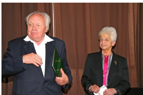
Möller díj 2007

Román András Archívum kutatási és könyvtárhasználati szabályzata