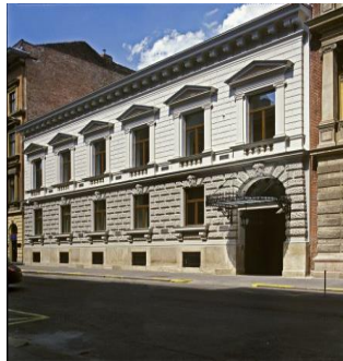
Budapest, Hatvany Deutsch palota (Spanyol Nagykövetség)