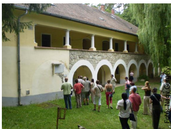
Az üresem álló kácsi gyógyfürdő

A program és végkicsengése valóban gondolatébresztő volt, hiszen a fent végigjárt kérdéskört más vetületben másképp is láthattuk: Hogyan viszonyul a társadalom a műemlékvédelemhez? Ezzel kapcsolatban az előadások nyomán kérdések sorát lehetett feltenni: Kié a műemlék? – a mai tulajdonosé, aki egy sokszázéves épülettel bármit tehet? Egyáltalán mi műemlék? A konferenciát az Olajos Csaba szervezte kirándulás nagyszerű szemléltetéssel egészítette ki.