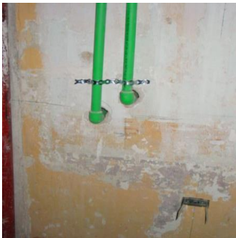
Esztergom, Északi kanonoksr