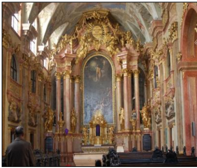
Győr, Szent Ignác templom