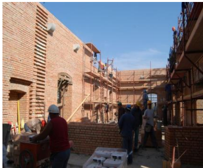
Nyírbátori Báthory várkastély