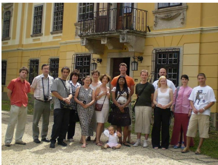
A konferencia résztvevőinek egy csoportja a noszvaji kastélyparkban

A Román András Műemlékvédelmi Nyári Egyetem (37. Egri Műemlékvédelmi Nyári Egyetem) előadásairól különszám jelenik meg 2007 őszén.