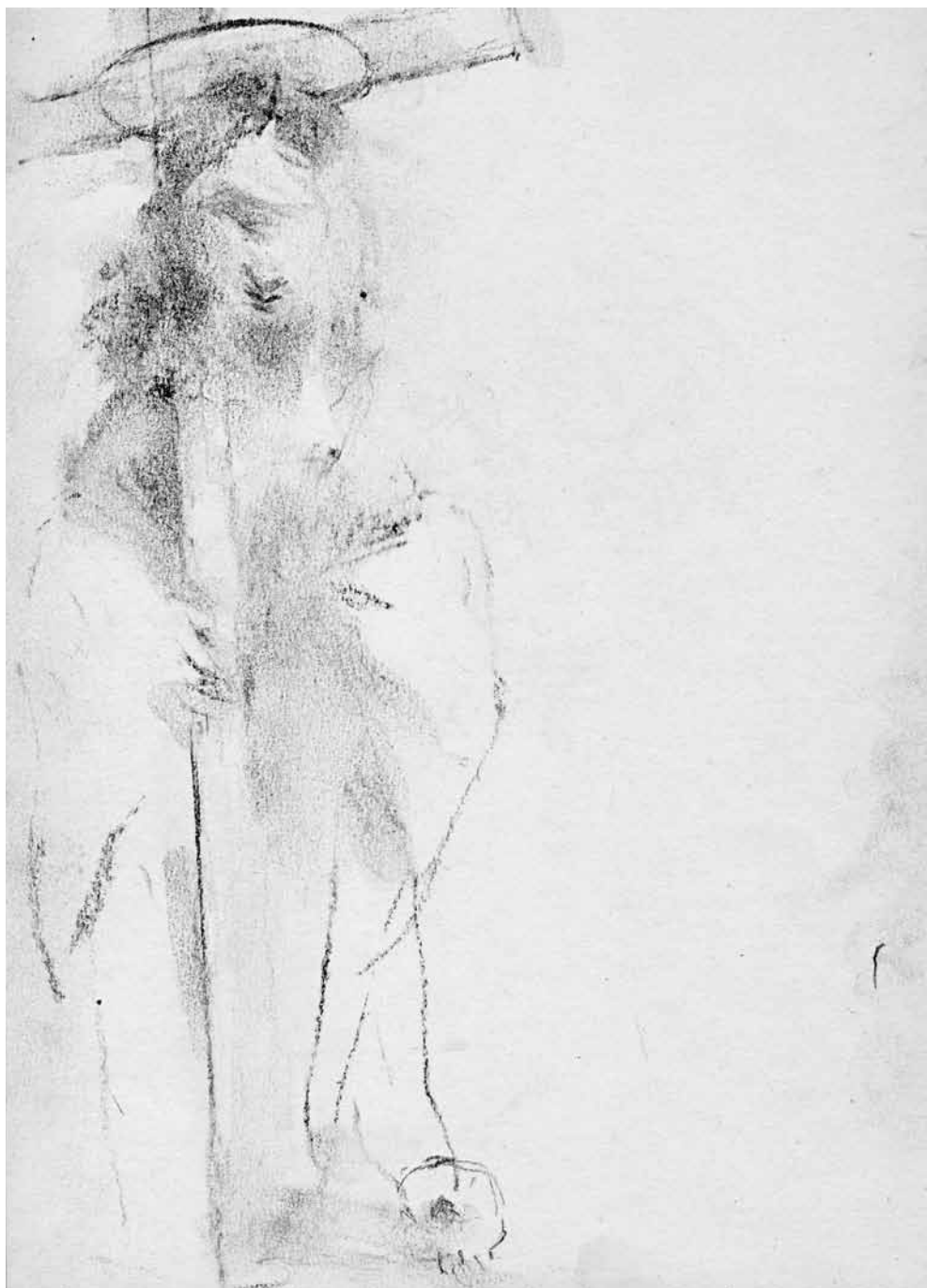
Kárpáti Tamás számunkban közölt műveinek adatai: Rajz, 2011, szén, papír, 210x297 mm A 97. oldalon lévő kép 1991-es