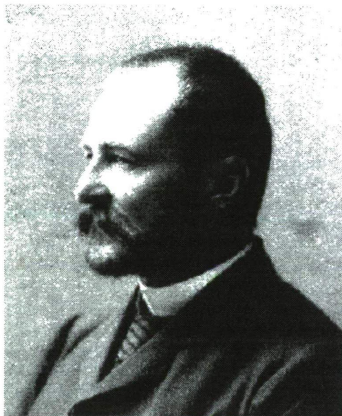
Gr. Tisza István

Tisza István mindenre elszántan és semmivel sem törődve ismételte a modern Európa közepén egy már alig látszó kerek és egyensúlyos világ alapigéit. Nem egyszerűen korszerűtlen volt. Egy világ tűnt el körülötte, s ő erről nem akart tudomást venni.