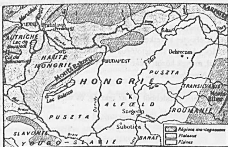
Francia tankönyvből. Dunántúl nagy részét pusztának tünteti föl.

Az osztrák-magyar kiegyezés után azonban nagy pezsgés indult meg az országban, szinte forrt a levegő az ugrásszerű fejlődéstől. Mocsarakat csapoltak, folyókat szabályoztak, az ipar is erőteljes fejlődésnek indult. Nemcsak Budapest - vagy ahogyan (a német minta után) a nyugati térképeken jelölték: Ofen-Pest - volt az egyetlen iparosodott város. Igaz, aki ezt a város valaha is látta, az a legnagyobb csodálattal adózott, s Európa legszebb városaként emlegette.