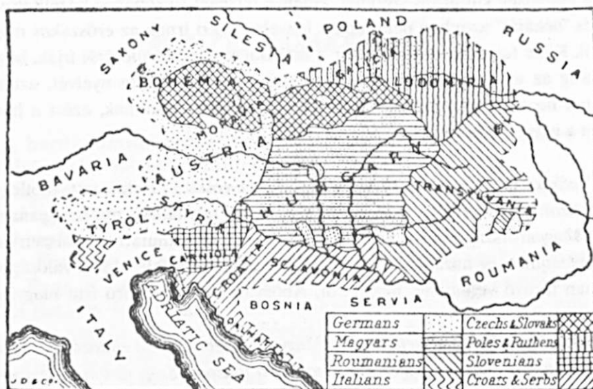
Háború előtti angol földrajzi tankönyvből. A régi Magyarország határa nincs megjelölve.

Minden fejlődés ellenére a francia tankönyvek pusztaként láttatták a század- elő Magyarországot, ahol szinte sivatagi körülmények vannak, ahol alig élnek em- berek, akiknek életmódjában megtalálhatók az ősi nomád szokások. Politikailag mindig a németeknek voltak alárendelve, s több száz évig a Habsburgok vezette ál- lamban éltek, ahol elnyomták a nemzetiségeket, így törvényszerű és jogos(!) volt az első világháború után a nemzetiségek önrendelkezési jogának érvényesülése - írják.