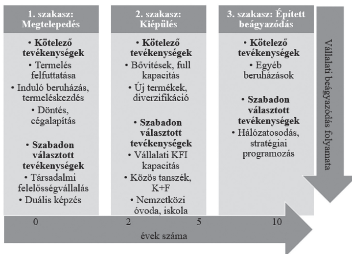
2. ábra. A vállalati beágyazódás szakaszai