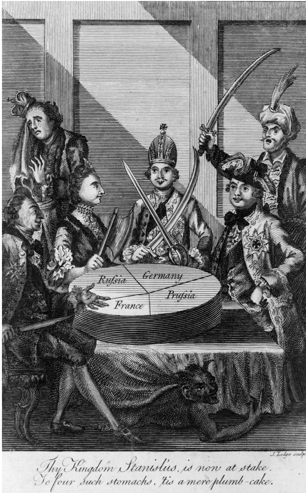
1. ábra. John Lodge The Polish Plumb-Cake című metszete

szabb értekezés például kizárólag a poroszok és az osztrákok felosztási terveit hangsúlyozta, „felmentve” az orosz cárnőt a felelősség alól (mindeközben azonban reálpolitikai érveket is felsorakoztatva):