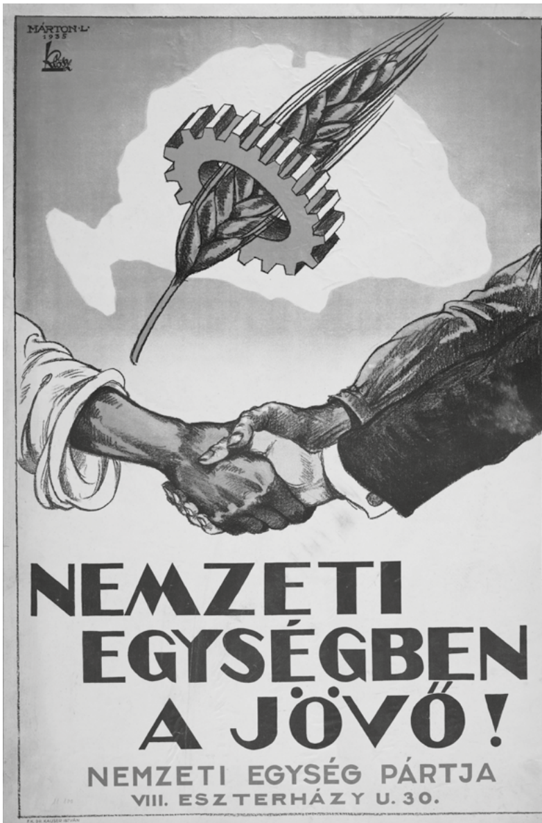
Nemzeti egységben a jövő! A Nemzeti Egység Pártjának 1935-ös plakátja. Forrás: Országos Széchényi Könyvtár Térkép-, Plakát-, Kisnyomtatványtára Eredeti: Márton Lajos. Jelzet: PKG.1935/289