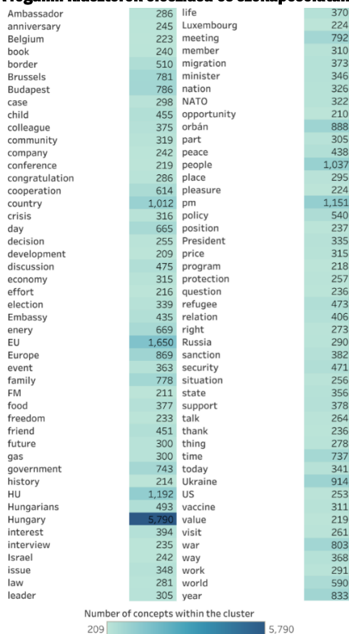
1. ábra: A fogalmi klaszterek eloszlása és szókapcsolataik száma

Saját szerkesztés, adatforrás: Kacziba, 2023a.