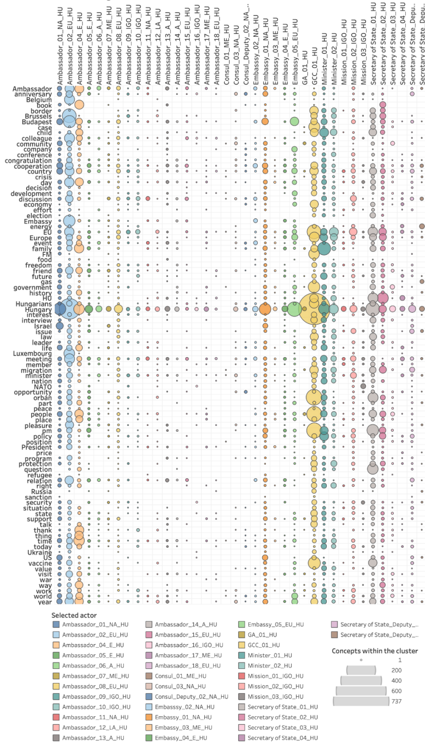
3. ábra: Fogalmi klaszterek felhasználók közötti eloszlása – 2021

Saját szerkesztés, adatforrás: Kacziba, 2023a.