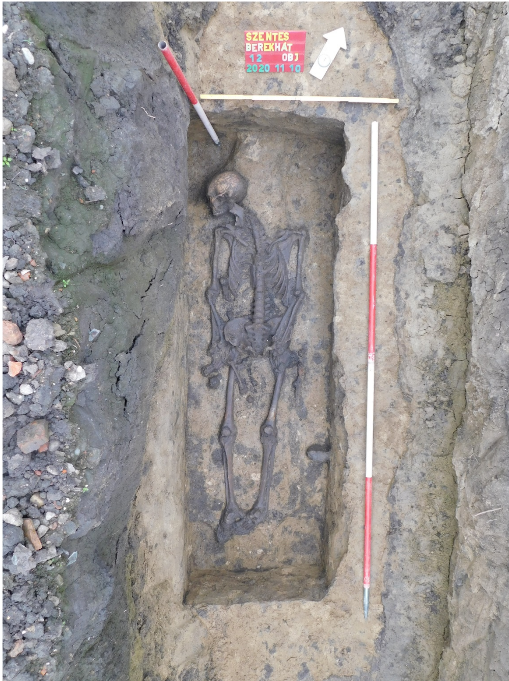
2. kép: A 12. sír

Mindhárom aknasír az avar kor második felében jellemző ÉNy–DK tájolással rendelkezik. A 12. sír négy sarkában kis mélyedések voltak megfigyelhetők, amelyek a koporsó meglétének bizonyítékai lehetnek, habár egyéb, koporsóra utaló nyomokat (vasszerelék, famaradvány) nem találtunk. A kutatás lábbal ellátott, ácsolt koporsóra következtet ezek alapján.