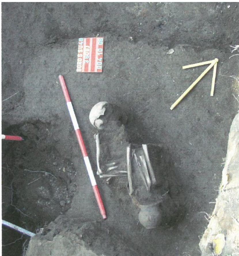
5. kép: Szentes, Boros Sámuel utca, 36. objektum.

bütyökkel díszített edény, és egy fordított csonkakúpos, füles csésze, mely valószínűleg a bolygatás során került el a közvetlen közeléből.