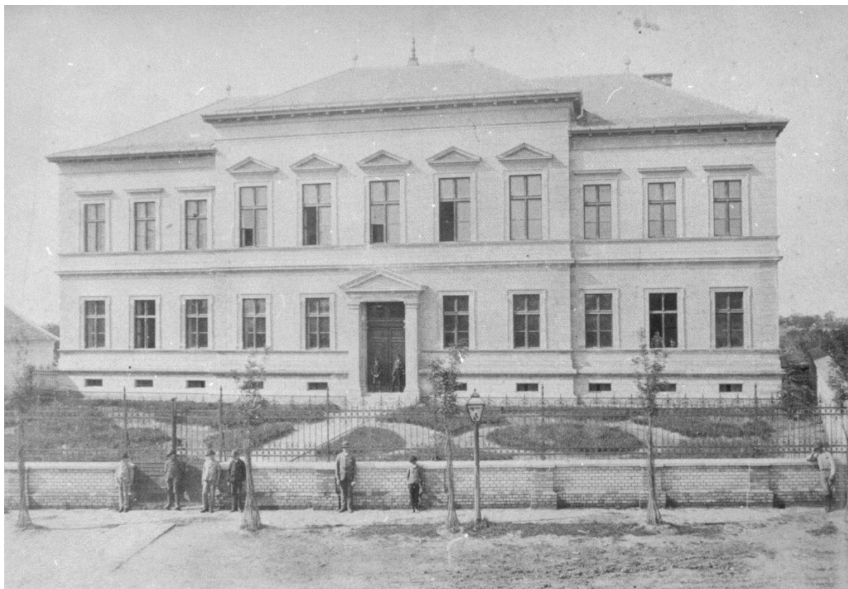
A gimnázium épülete 1888-ban