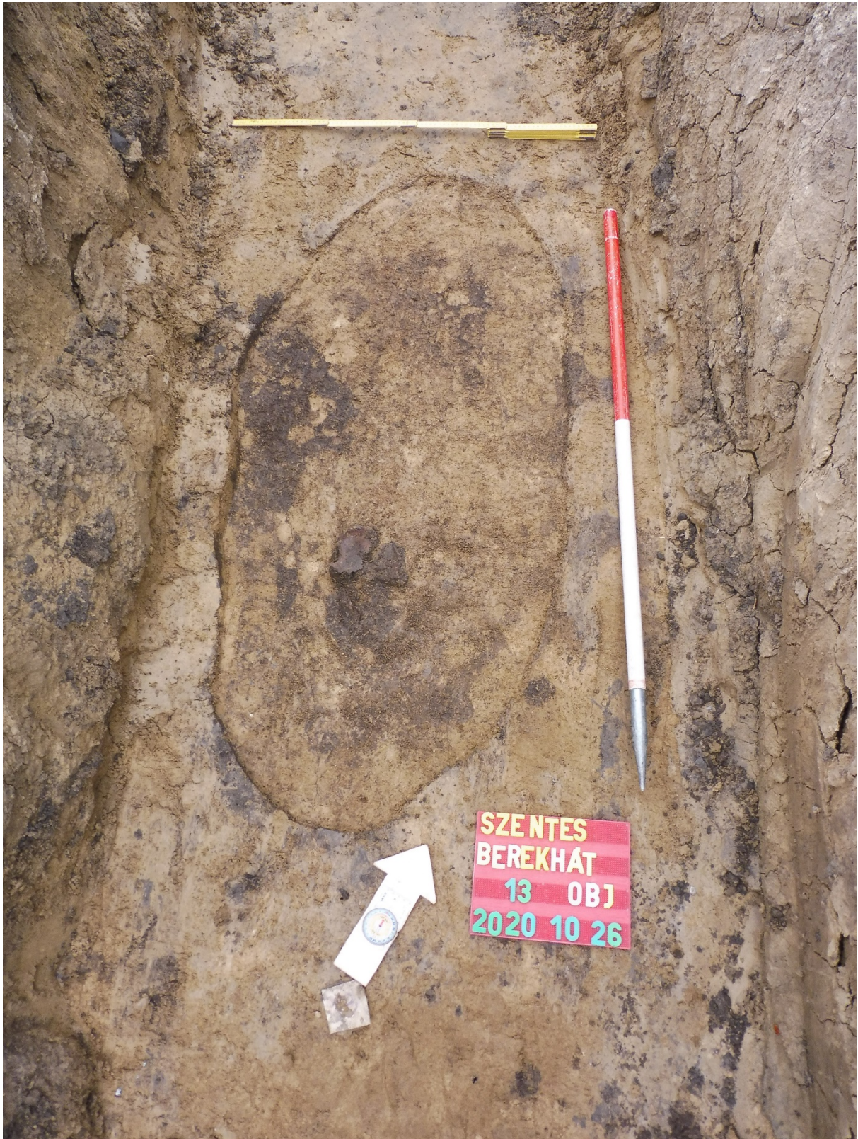
1. kép: A 13. sír