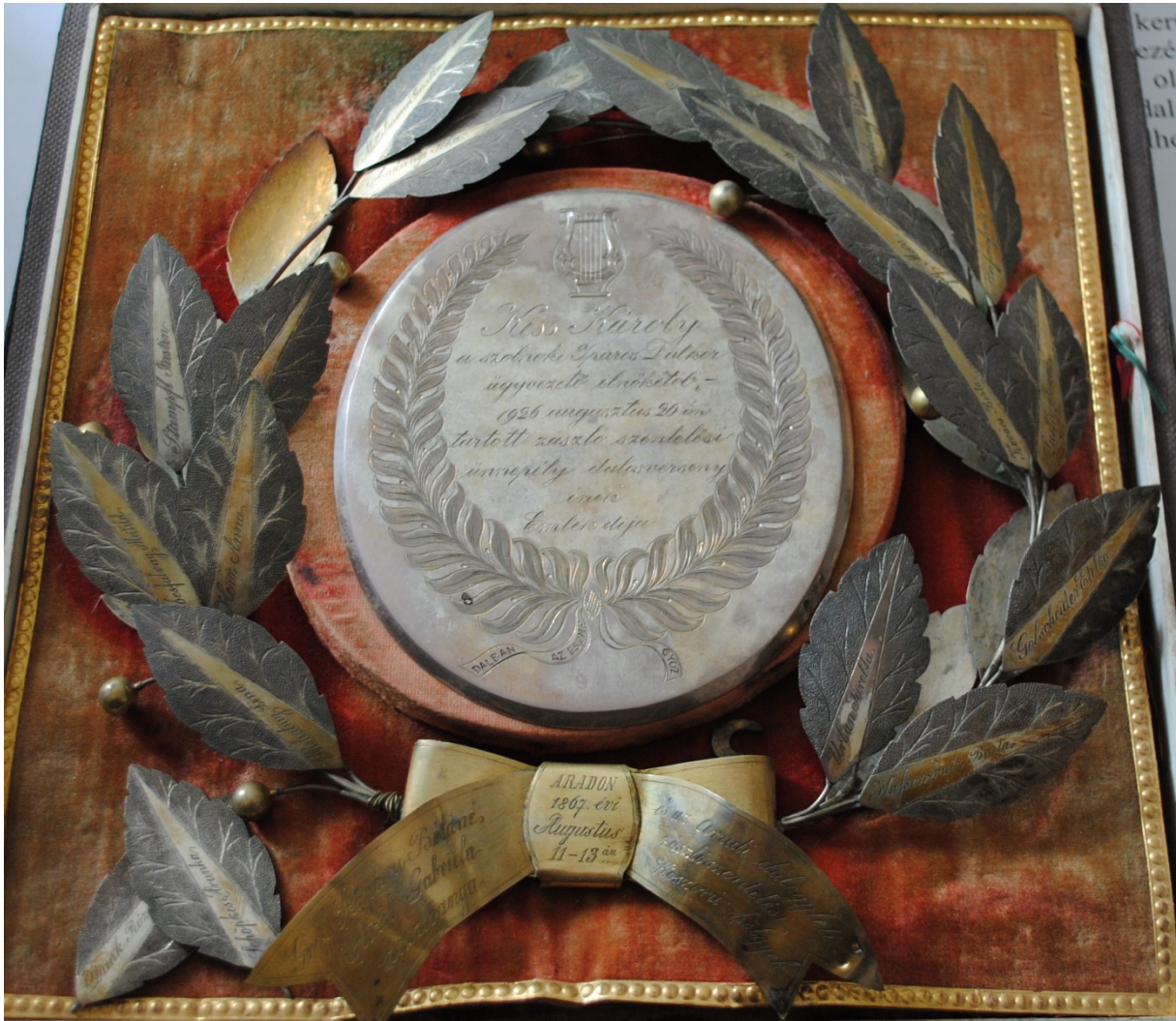
A gimnáziumból a múzeumba átkerült ezüst babérkoszorú

pókrészt, 2 koráit, és egy szárított trigon farkat.” 11