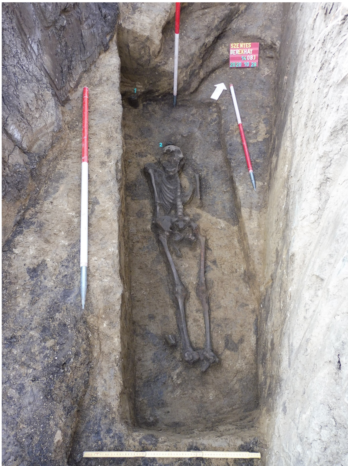
4. kép: A 14. sír

A 12. sírban nyugvó férfit öntött bronzveretekkel díszített övgarnitúrával indították utolsó útjára.