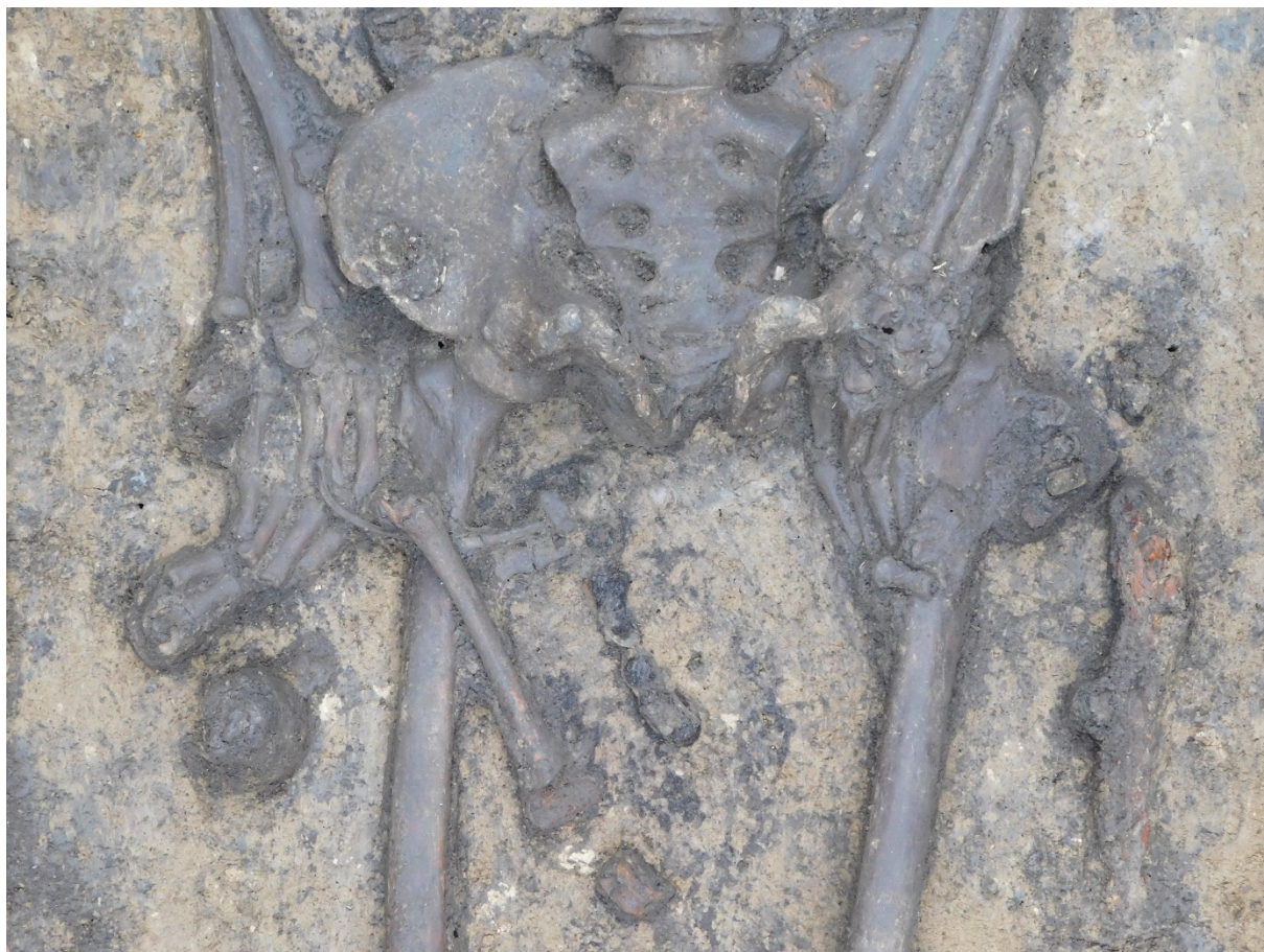
3. kép: A 12. sír részlete a férfi övgarnitúrájával

A három temetkezés közül kettő tartalmazott csak leleteket. A mellékletek körébe tartozik a 12. férfisírból az elhunyt bal combcsontja mellől előkerült, eredetileg az övről függő egyélű vaskés, melynek felületén a fatok maradványai is jól megfigyelhetőek voltak.