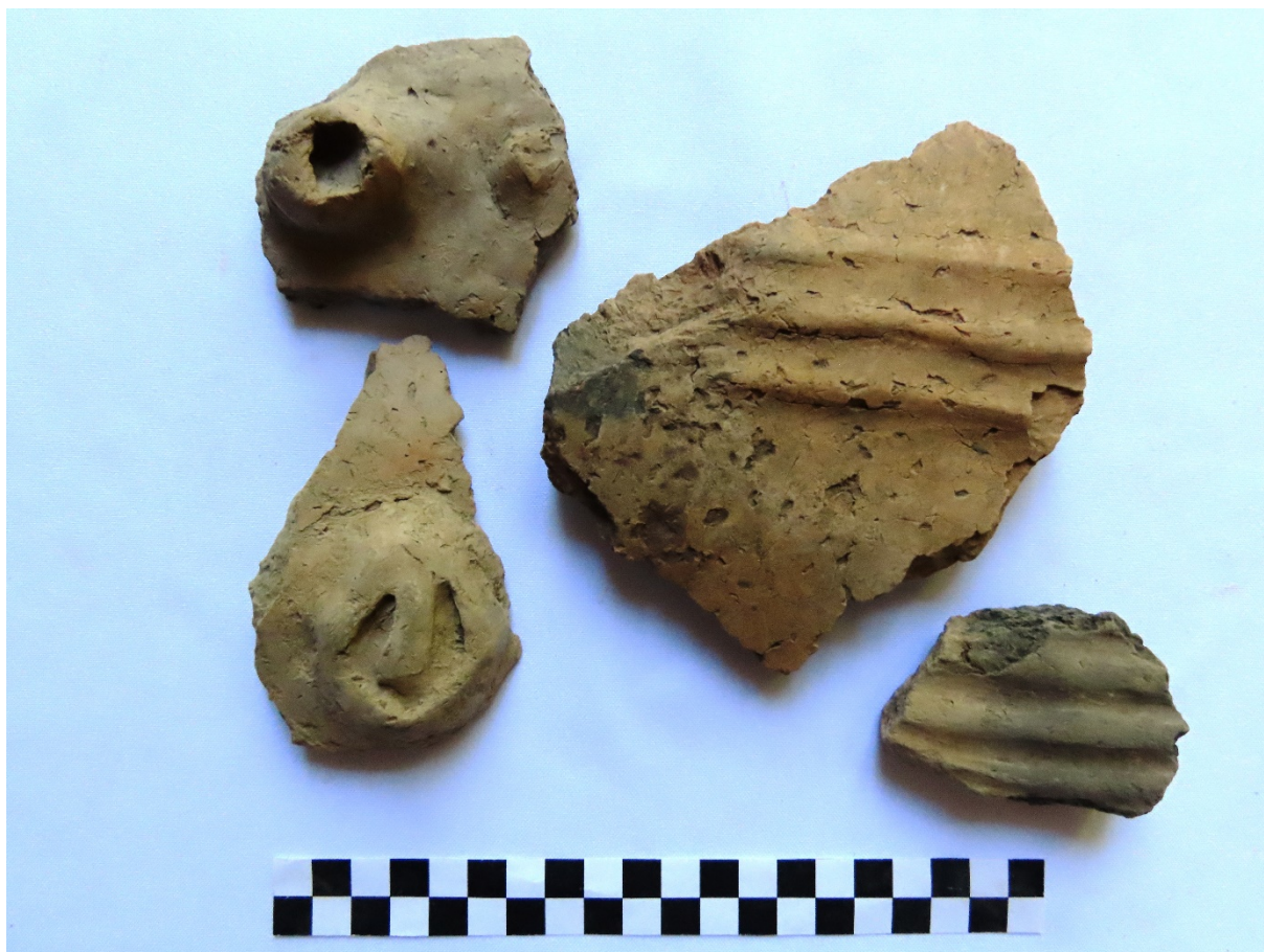
3. kép: Szentes, Boros Sámuel utca, 37. objektum.

Két temetkezés is előkerült a feltárt objektumokból. Az egyik esetben csak a váz felső része és egy sípcsontja maradt meg. Zsugorított testtartású, a bal oldalán fekvő váz, melynél jól láthatók az arc elé hegyesszögben behajlított karcsontok. Tájolása É–D. A másik temetkezés is egy erősen zsugorított testtartású váz, mely feltehetően a hátán fekszik, a jobb kar pedig derékszögben behajlítva, a medencén keresztben van elhelyezve. A lábakat olyan erősen felhúzták, hogy a combcsontok csaknem párhuzamosak a jobb felkarral. Tájolása ÉNy-DK. Edénymellékletei is voltak, egy enyhén kihajló peremén ujjbenyomásokkal, öblös hasán négy szimmetrikusan elhelyezett, függőlegesen tagolt