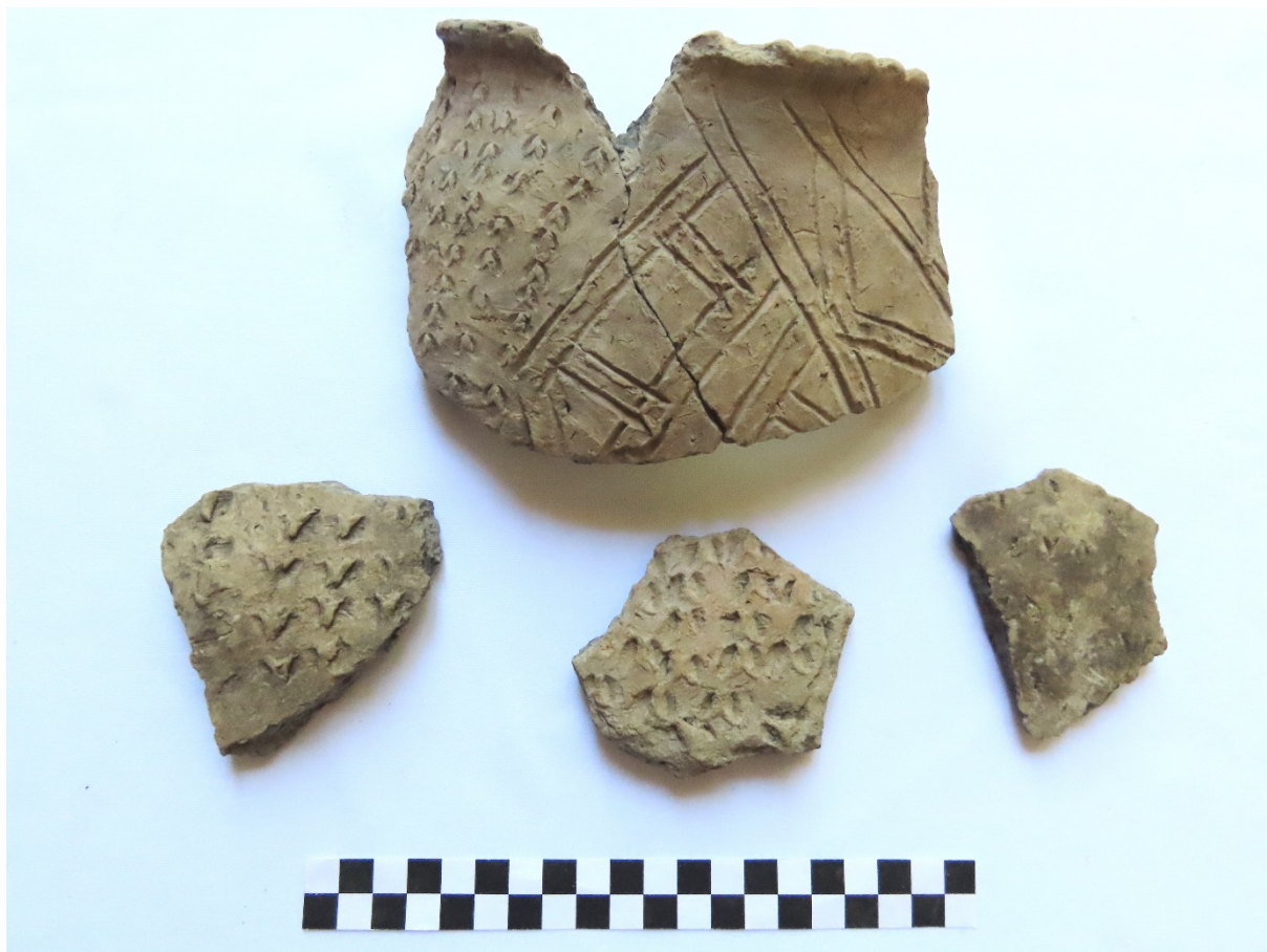
2. kép: Szentes, Boros Sámuel utca, 18. objektum.

Az előkerült leletanyagot tekintve változatos a lelőhely, a Korsós sori anyaghoz hasonló. Megjelennek ugyanazok a díszítési típusok mindkét településrészleten. Vastagfalú, díszítetlen hombártöredékek és vékonyfalú, fényezett felületű edények, valamint lábas edények töredékei is előkerültek. A 18. objektumból származó egyik darabon együtt jelenik meg a körömcsíprés és a mintákba rendezett bekarcolás. A 37. objektumból fröcskölt barbotinos díszítés is napvilágot látott. Ugyaninnen kannelúraszerű besímított díszítés, és benyomott mintával tagolt bütyökdíszítés is megtalálható.