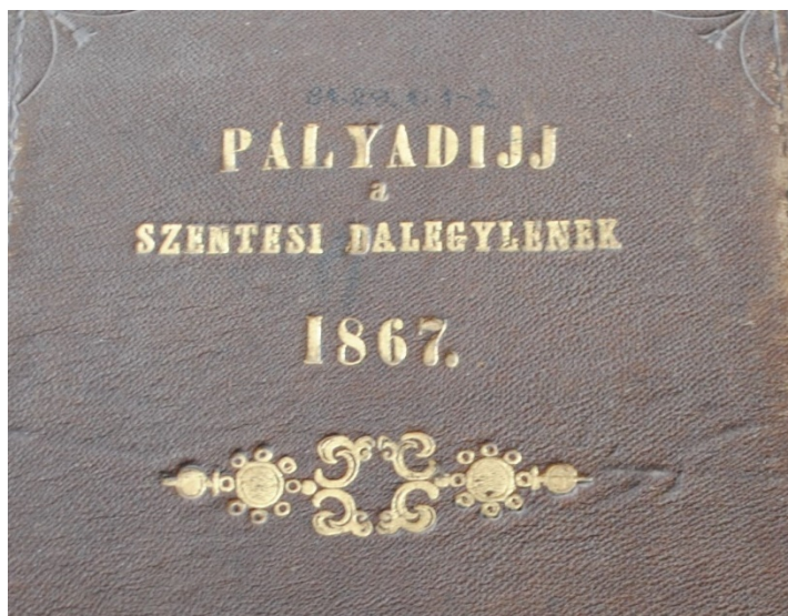
A babérkoszorú díszdobozának felirata