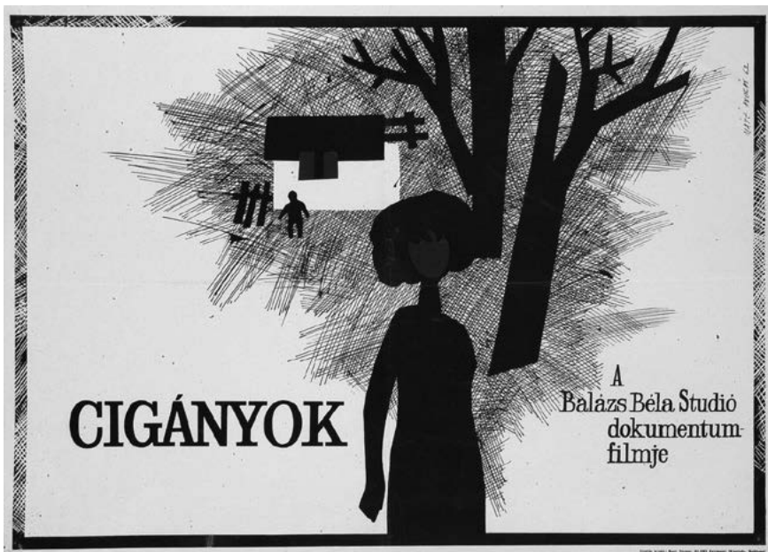
A film plakátja.

1956-ot követően a hatalomnak szüksége volt legitimációjának megerősítésére. Ennek egyik alapvető eszközének a filmet tartották. Az MSZMP 1958 nyarán tette közzé a Művelődéspolitikai irányelveit . 7 Ebben ugyan nagyobb teret adtak az alkotóknak, ugyanakkor a hatalom is egészen más eszközökhöz nyúlt, mint korábban. Úgy tartják, hogy egy sokkal liberálisabb filmirányításról beszélhetünk, ami a Rákosi-korszakhoz képest igaz megállapítás, de ez nem jelenti azt, hogy az alkotók szabadon készíthették a filmjeiket. Egy nagyon tudatosan megszervezett, stratégiai fontosságú művelődéspolitikáról beszélhetünk, mely látszólag szabadon engedte