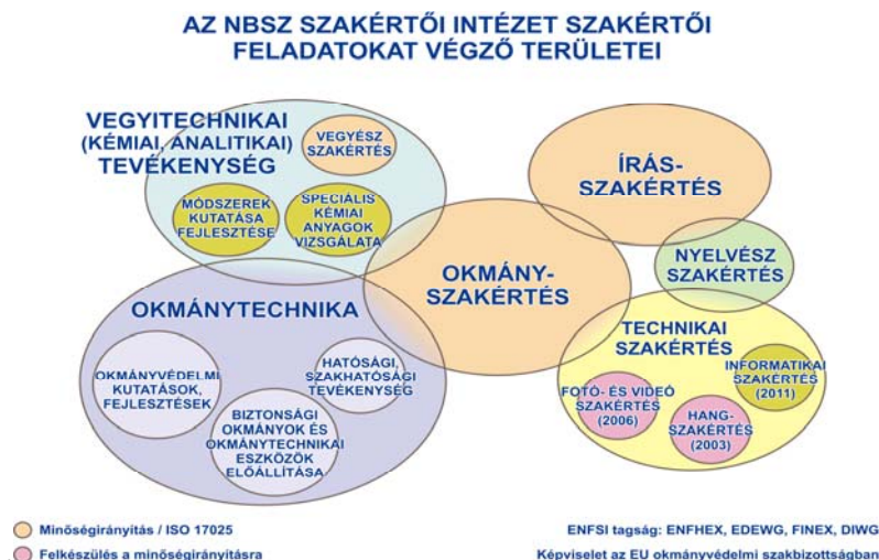
2. ábra: A tevékenység szakértői területei napjainkban az NBSZ Szakértői Intézetben

képesség. Természetesen az alapként szolgáló szakmai tudás mellé szükség volt még a kapcsolódó egyéb szakértői ismeret (jogi, eljárási stb.) megszerzésére is. Meg kell említeni azonban azt is, hogy a szakértői tevékenységből származó tapasztalatok mutatják meg, hogy az okmányvédelmet mely területeken kell fejleszteni, melyek a hamisítók által leginkább támadott részei egy okmánynak. Ennek a tudásnak, információnak a birtokában tervezhetőbbé válik a védelem az okmányvédelemmel foglalkozó szakemberek részére.