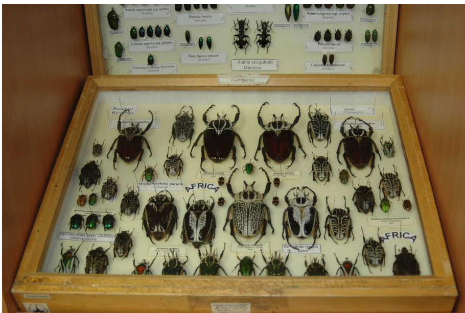
Afrikai rózsabogárfajok

Sár József szerint a Rovarház elsősorban iskolák, ökoturisták, a Duna-Dráva Nemzeti Parkba látogatók, érdeklődők figyelmére számíthat.