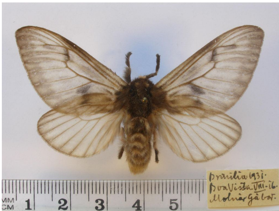
Megalopyge lanata Molnár Gábor gyűjtéséből

Talán nincs olyan magyar lepkész, aki ne ismerné Molnár Gábor (1908–1980) könyveit. Nagyszerű író volt, tehetséggel megáldott ember. A korszellem is hozzájárulhatott, hogy a második világháború után könyveit nagy példányszámban jelentették meg a különféle állami könyvkiadók. Az amazóniai őserdő, a vadászskalandonok és a csillagfényes-karbidlámpás éjszakák hangulatai és élményei – tökéletes leírásuk minden olvasónál célt ért, tapasztalatból tudom. És hogy a lepkékhez kanyarodjunk: Molnár Gábor nemcsak vadászott, hanem rovarokat is gyűjtött, köztük pikkelyröpűeket is! A karbidlámpás éjszakai gyűjtései meggyőzhetik bármelyik lepkész kollégát, hogy a nagy vadász és író nemcsak a puskaravaszt húzogatta, hanem a gyűjtőüveget is gyakran borítgatta a kiszemelt áldozatok fölé.