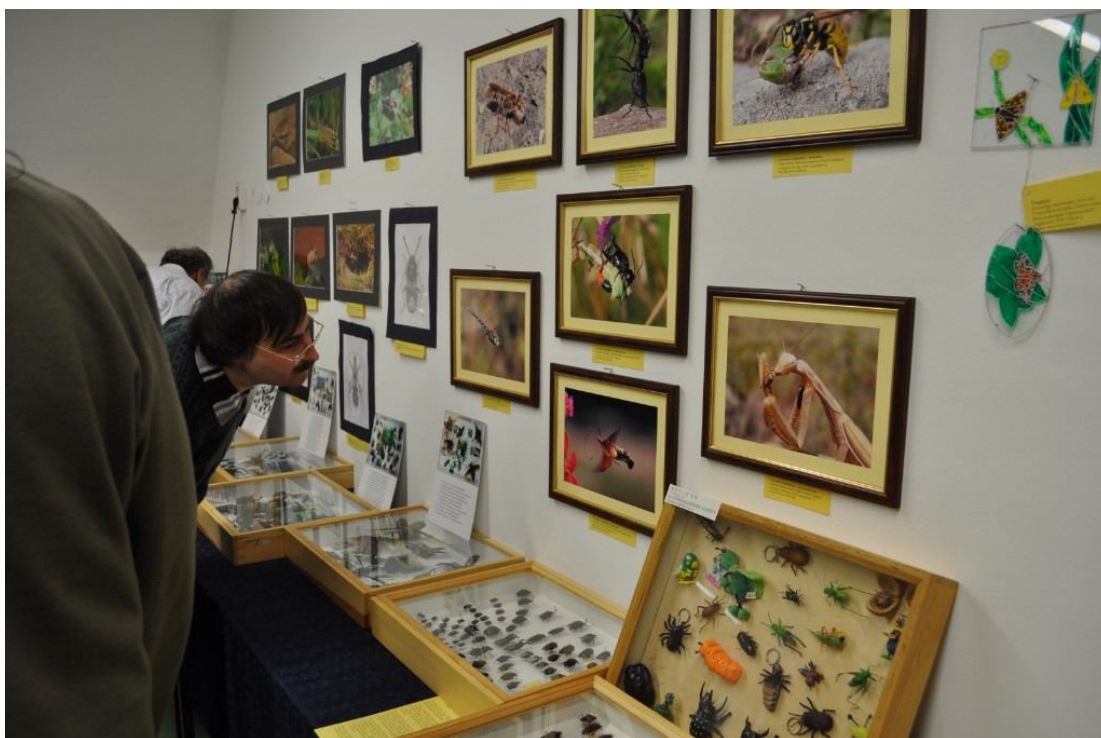
A különböző kategóriákban beérkezett pályamunkák kiállítása