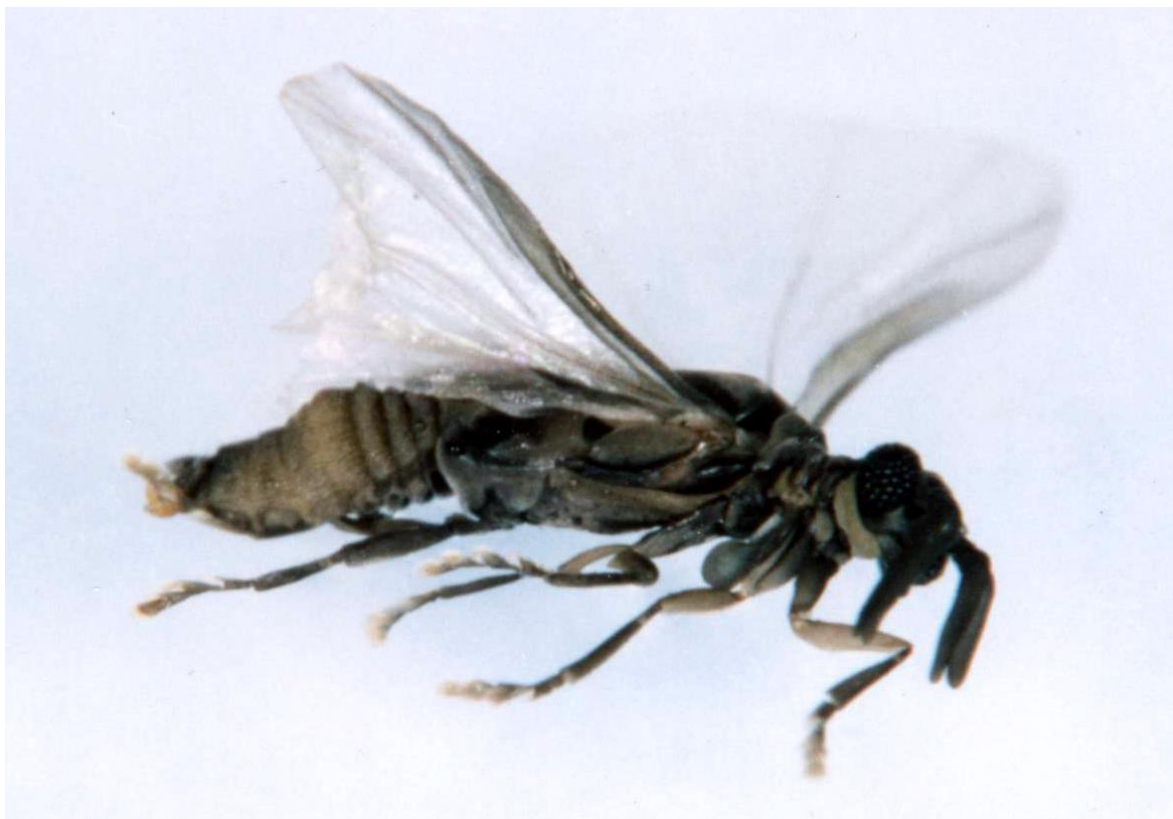
1. ábra: Xenos vesparum hím repülés közben