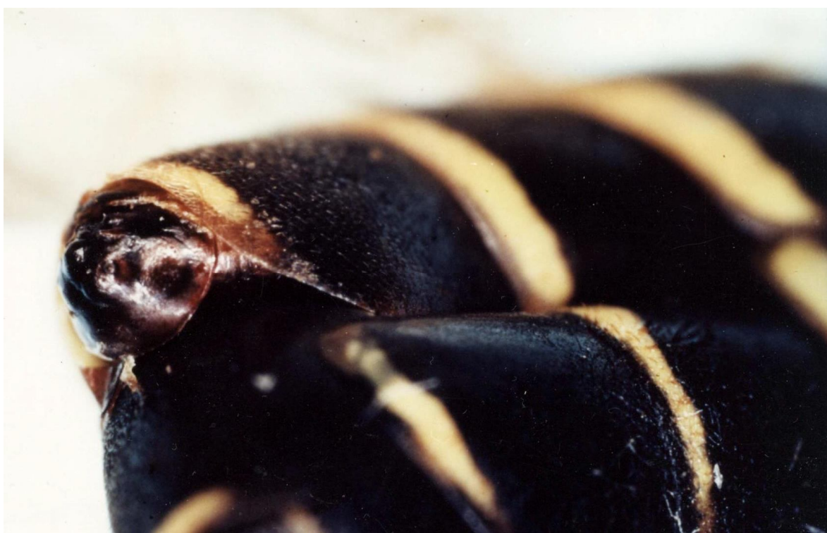
2. ábra: Xenos vesparum a Polistes dominula potrohából készül kirepülni. A hím kitüremplő fején a szemek is jól láthatók