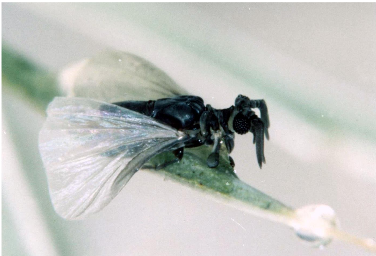
3. ábra: Xenos vesparum hím az ördögszekér levelén