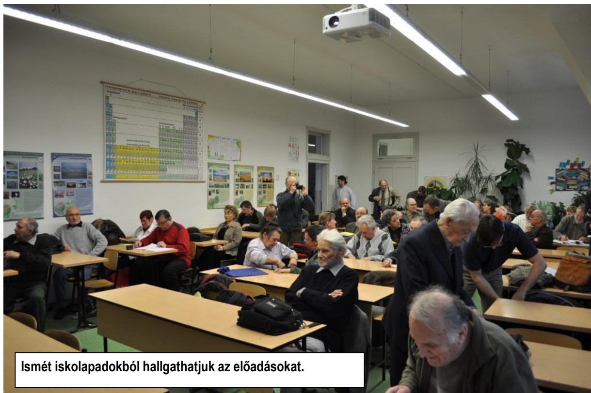
Ismét iskolapadokból hallgathatjuk az előadásokat.