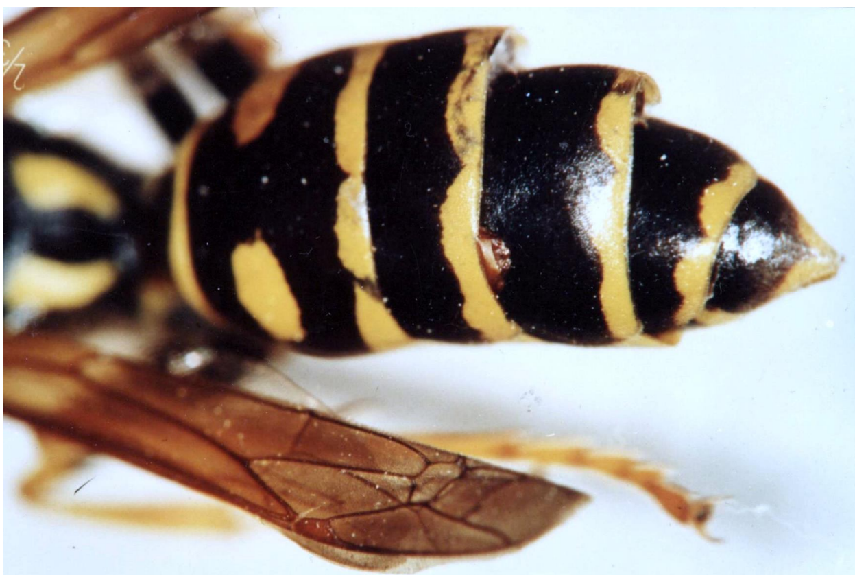
4. ábra: Xenos vesparum nőstény fejtorának vége, a gazdaállat 3. potrohszelvényéből (az ábrán alul) csak alig lóg ki. A 3. és a 4. szelvény felső részéből a hímek már kirepültek