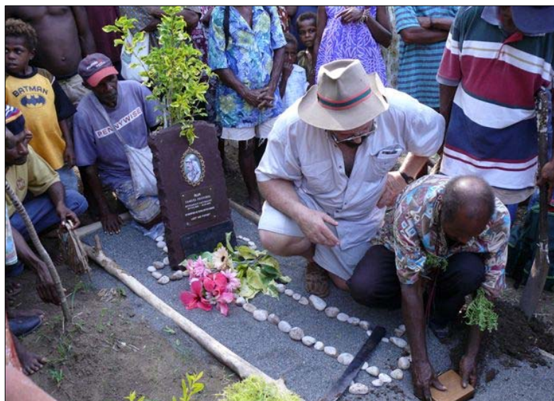
A Bethlen Kollégium küldeményének sírba helyezése.

De végül is elérkeztünk Bogadjimba. Már vártak bennünket, a falu aprajánagyja élénk sereglett. A falufőnök vendégszeretően fogadott. Nem sokat időztünk a bemutatkozással, üdvözléssel, inkább gyalogosan folytattuk utunkat, a temető felé. Árnyas ösvényen, banán, kakaó és dinnyefák között bandukoltunk, nyomunkban vagy száz helybélivel, Bogadjim egész lakosságával. Mintegy tízpercnyi séta után egyszerre csak megritkult a növényzet, s ott álltunk a stephansorti temetőben. Elsőnek a nagy fekete gránit síremlék ötlött szemünkbe, így rögtön tudtuk, jó helyen járunk. S néhány méterre