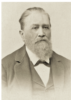
6. kép: Edmund Matejko portréja (OSZK Kézirattár, Lengyel album)