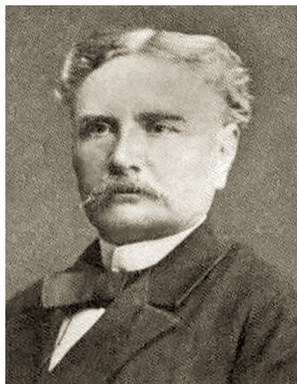
1. kép: Aleksander Karłowski portréja (Kraków, Muzeum Naradowe, Album Szybalskiego)