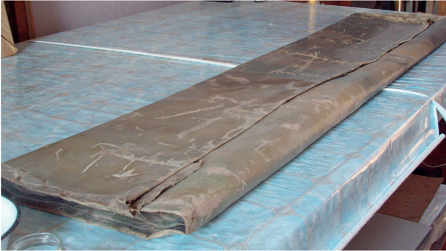
2. kép: W. Smokowski olajfestménye a jelgavai Gederts Elias Történeti és Művészeti Múzeum raktárában, feltekerve