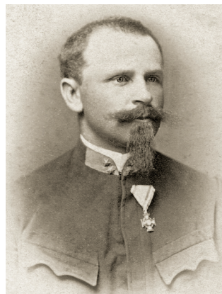
4. kép: Felicjan Szybalski portréja