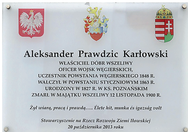
2. kép: Aleksander Karłowski tiszteletére az ilówi katolikus templom falán elhelyezett emléktábla

Nagyhercegségben, és 1900. november 12-én halt meg Szeliwy nevű birtokán. Felesége, Paulina z Tuchołków 1841 körül született szintén a Poznańi Nagyhercegségben, és férje birtokán halt meg 1901. február 12-én. Több gyermek gyászolta őket. A lexikon 2016-ban megjelent lengyel nyelvű változatához sikerült megszerezni Karłowski fényképét, amelyet itt is közlünk (1. kép). Ugyancsak Piotr Antoniak fedezte fel, hogy a Varsó és Płock közötti útvonalon fekvő Hłów katolikus templomának külső falán található egy emléktábla, amelyet az Hłówi Föld Fejlesztéséért Társaság állított 2013. október 20-án Karłowski tiszteletére – jelezve, hogy az erdélyi lengyel légió tisztje az 1863–1864-es orosz-lengyelországi (januári) szabadságharcban is részt vett (2. kép).