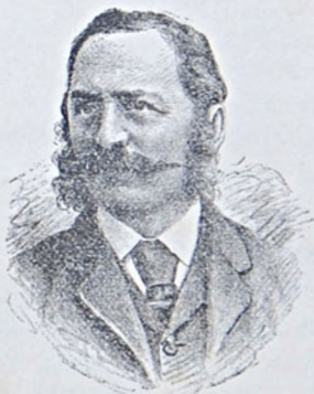
SZONGOTT KRISTÓF 1843—1907.