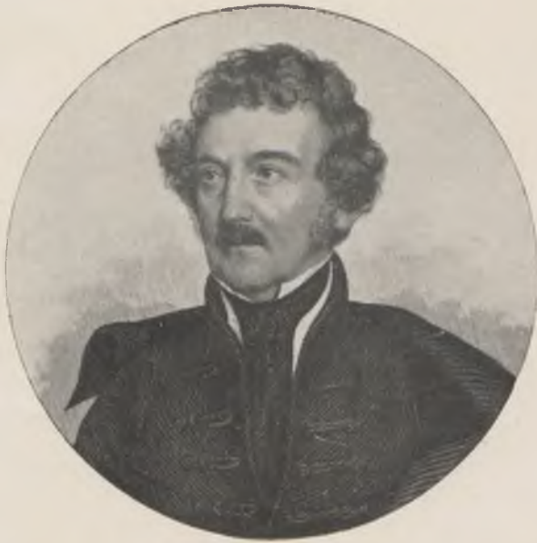
Fáy András (1786—1864)