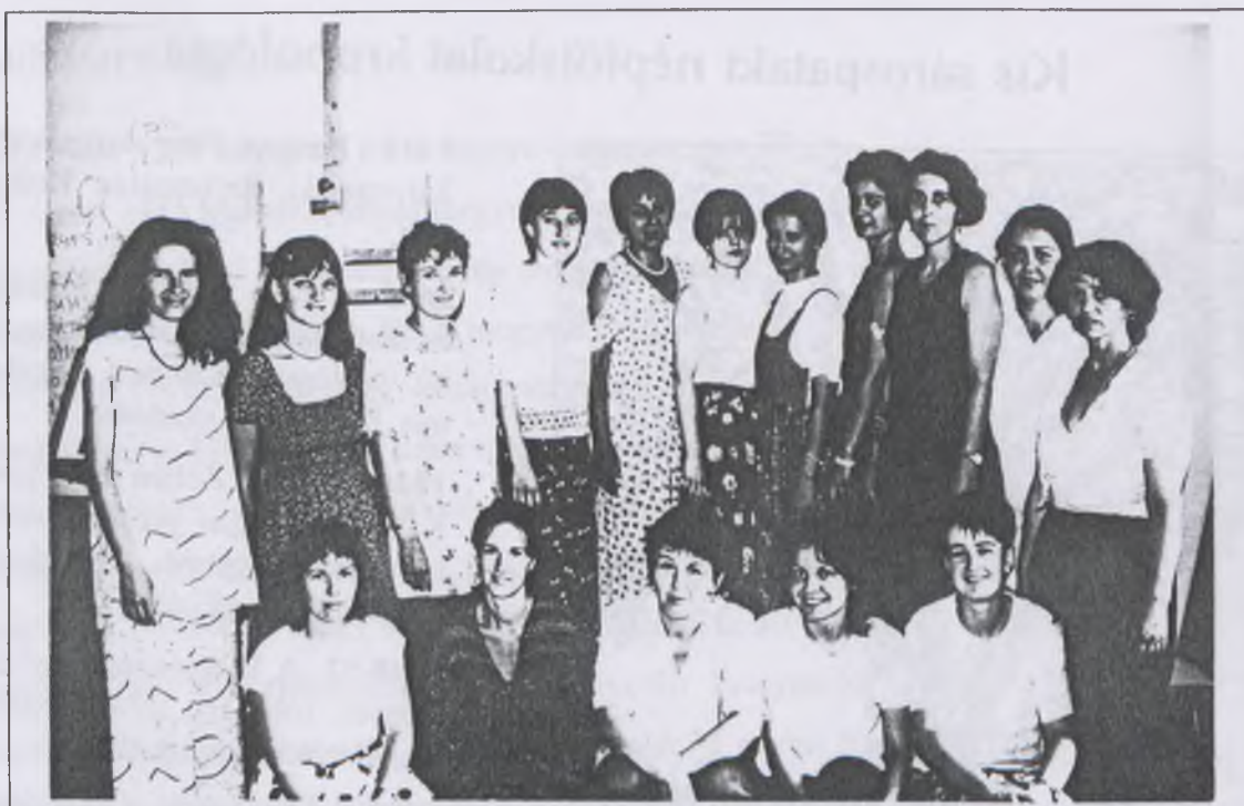
A művészeti szekció tagjai